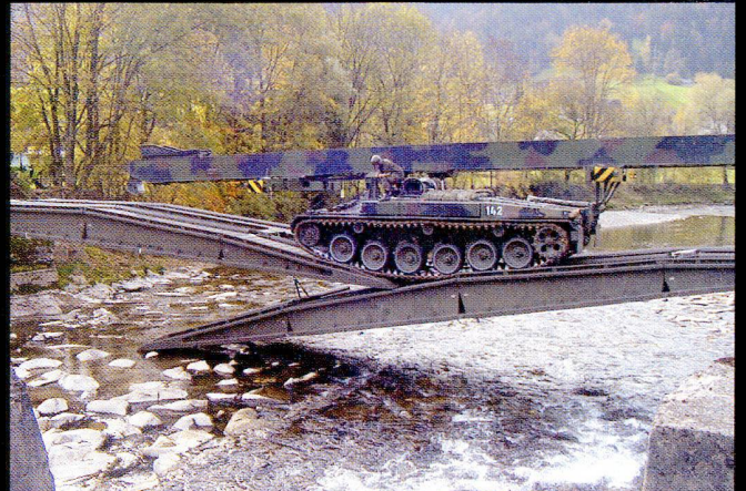
Le char poseur de pont 68/88 permet de franchir des coupures jusqu'à 18 mètres. Armeefilmdienst.