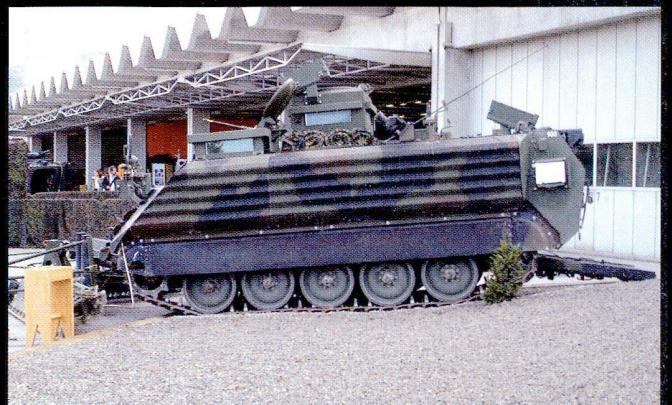
Le char de déminage léger 00 est en mesure d'ouvrir, de déblayer et de faire détonner des mines sur surface dure.