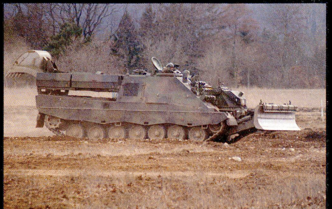
Le char du génie permet d'ouvrir des brèches en terrain meuble. Il est équipé d'une lame, d'un bras articulé et peut recevoir un système de déminage lourd.