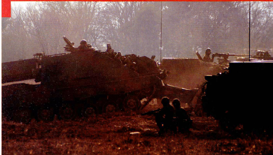
Le char de génie ouvre une brèche, couvert par une section de sapeurs dont la tâche est également de marquer et de régler la circulation.