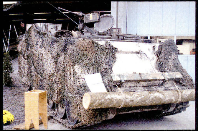
Les sapeurs de chars sont transportés en chars du Génie 63 (M-113).