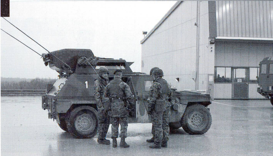
Chaque compagnie lance-mines de chars possède 3 commandants de tir (2 mécanisés et un motorisé). Cp Im chars 12/5. En as : camouflage d'un ZVBA.