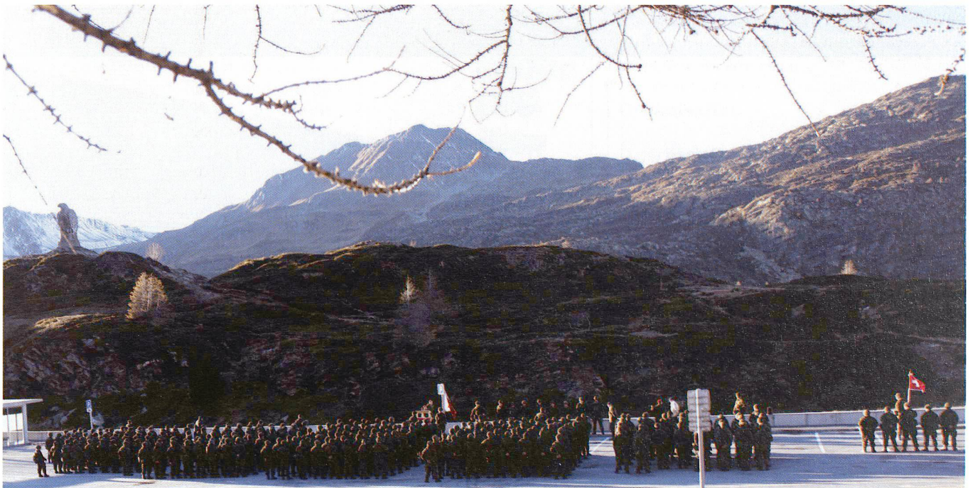
Remise de l'Etendard au pied de l'aigle du Simplon.