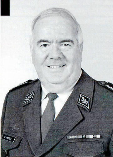
Cdt corps Dominique Andrey, commandant des Forces terrestres