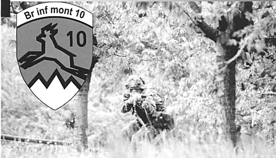
Br inf mont 10