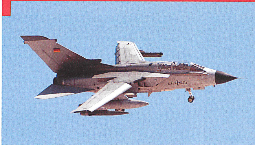
Le Tornado est la monture principale de la Luftwaffe et de la RAF. Il est ici équipé de pods de guerre électronique et de bidons.