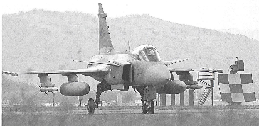
Le SAAB Gripen (à gauche), le Dassault Rafale (ci-dessous) et l'Eurofighter Typhoon (page suivante) sont des candidats au remplacement des Tigre.