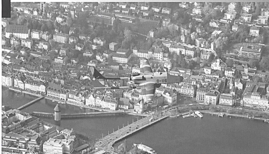
ADS 95 survolant Lucerne