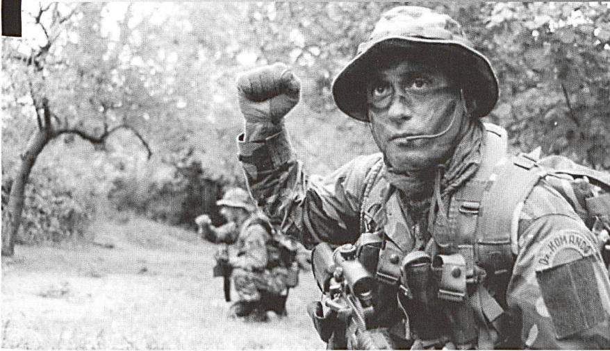
Illustrations © Forces spéciales turques