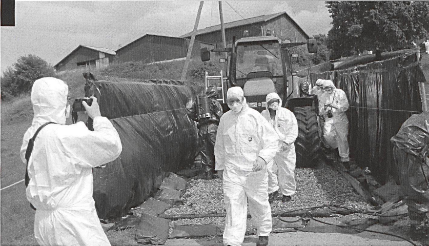
Autoluve monté par une formation d'intervention en cas de catastrophe.