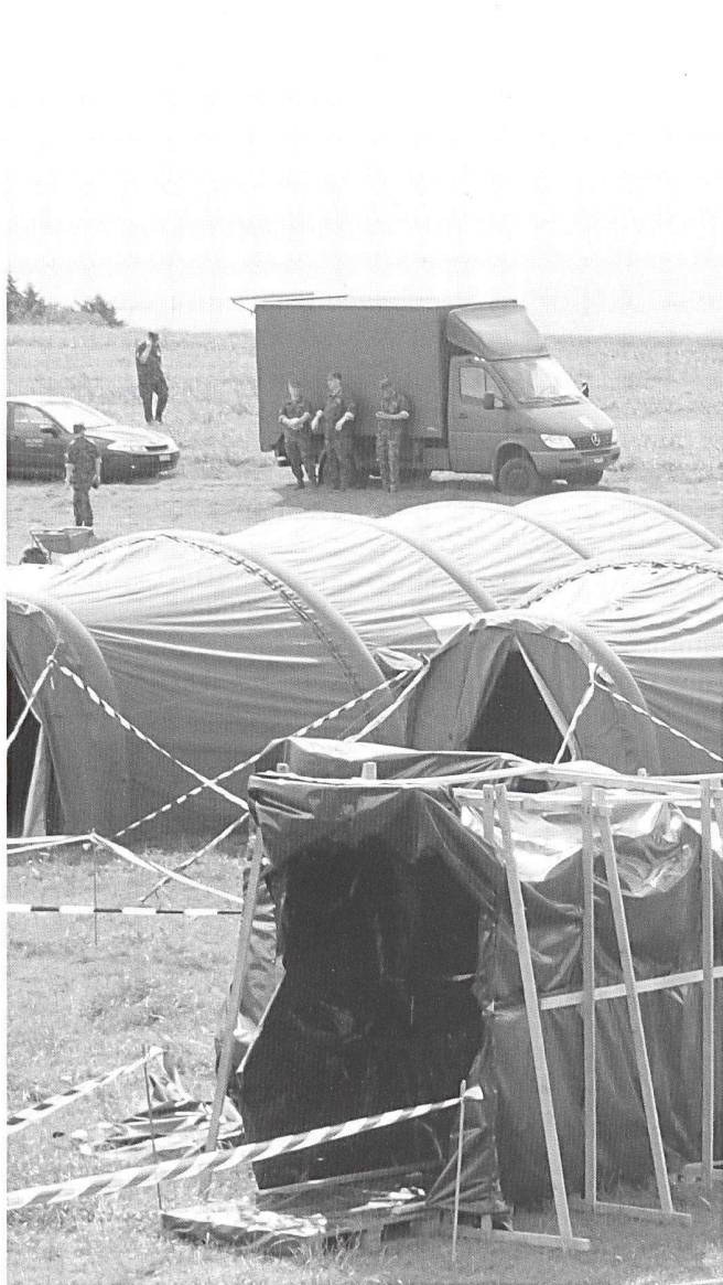
3 Sas d'entrée/sortie de la zone contaminée avec, à l'avant, un passage de décontamination avec douche.