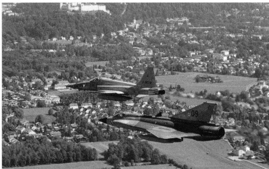
Vol de convoyage des F-5, escortés par des Draken.

Les Draken connaissent l'épreuve du feu durant le conflit des Balkans. Le 28 juin 1991, un Mig-21