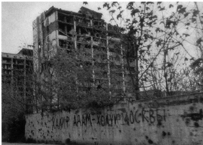
La ville de Grozny détruite.

Comme pour toute opération militaire, quelle que soit la méthode de raisonnement, il convient de mettre en évidence les conséquences des caractéristiques des zones dans laquelle elle se déroule. Sans vouloir se livrer à une analyse complète différenciant les secteurs urbains (centre, banlieues de toutes natures, périphéries commerciales) quelques règles bien spécifiques s'imposent avec force. D'abord, tiré de toutes les leçons apprises