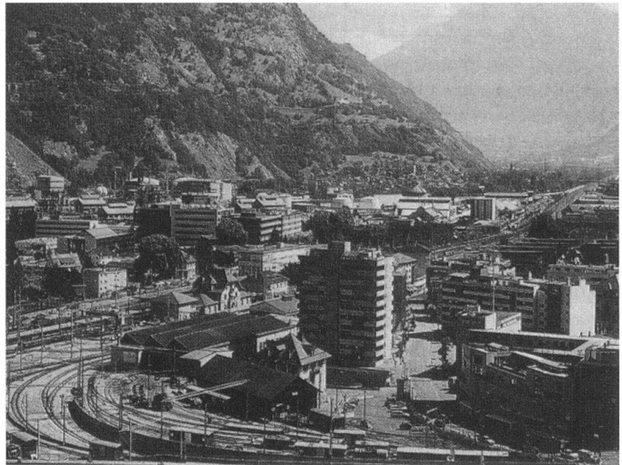
La vallée du Rhône urbanisée en Valais.

Partout dans le monde, selon les conditions climatiques, les villes sont le théâtre privilégié de violents incendies et des fumées qui les accompagnent. C'est un truisme de dire que les actions de guerre seront une source active du déclenchement de ces sinistres. Au-delà des effets sur les populations civiles s'ajouteront les effets de cloisonnement, de masque et d'isolement qu'il faudra savoir contenir, anticiper, interdire, sans parler de l'obscurité, de la perte de visibilité directe et des pollutions connexes parfois mortelles. La prévention et la maîtrise de ces phénomènes apparaîtront très vite de première importance.