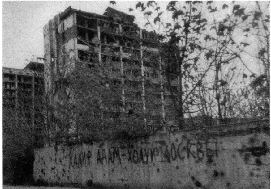
La ville de Grozny détruite.

Comme pour toute opération militaire, quelle que soit la méthode de raisonnement, il convient de mettre en évidence les conséquences des caractéristiques des zones dans laquelle elle se déroule. Sans vouloir se livrer à une analyse complète différenciant les secteurs urbains (centre, banlieues de toutes natures, périphéries commerciales) quelques règles bien spécifiques s'imposent avec force. D'abord, tiré de toutes les leçons apprises