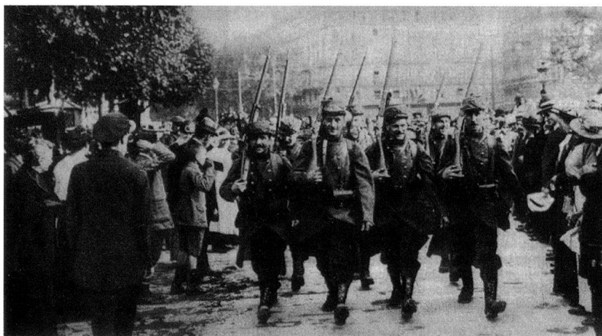
Paris, 3 août 1914.

Les exemples de mauvais comportements sont nombreux et l'on peut citer celui qu'eut