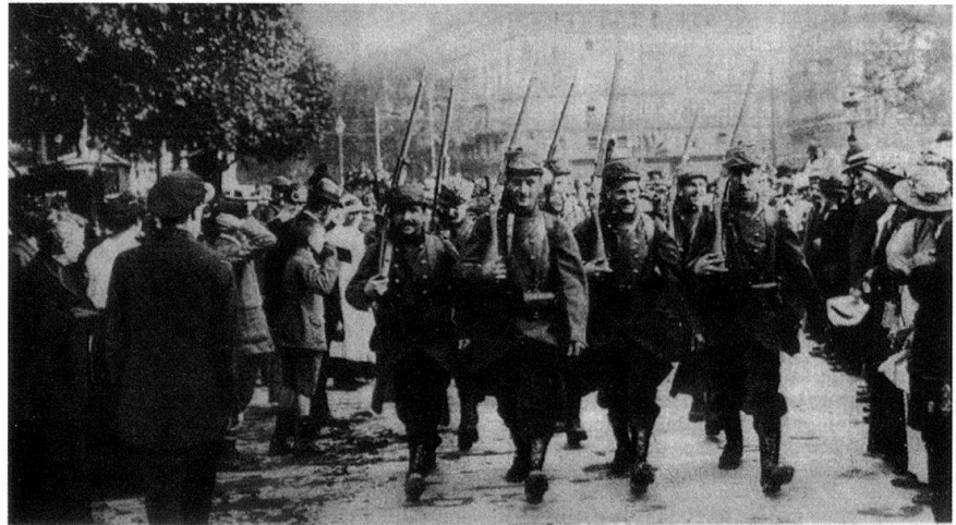
Paris, 3 août 1914.

Les exemples de mauvais comportements sont nombreux et l'on peut citer celui qu'eut