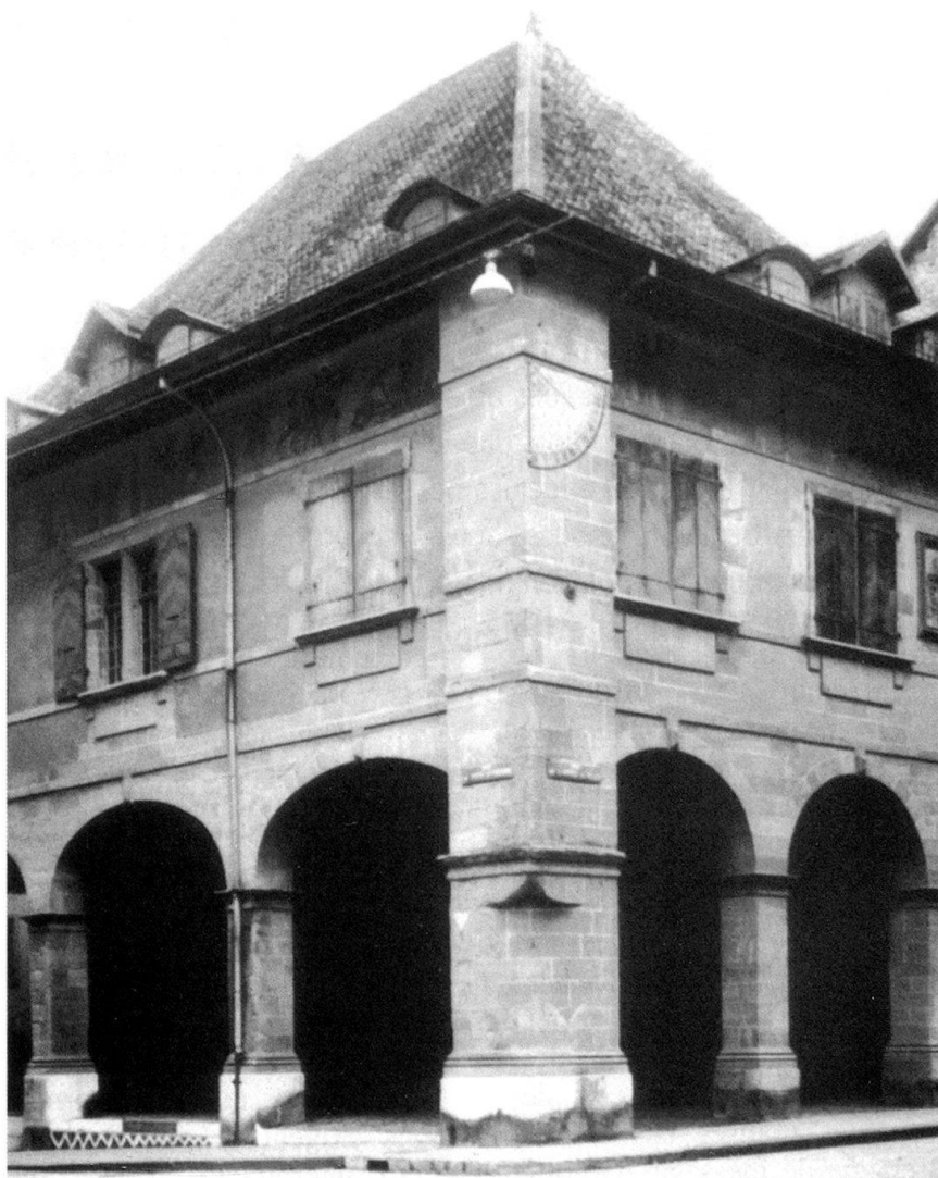
La Halle, arsenal cantonal 1720-1877.

Genève, aujourd'hui, est confrontée à de redoutables et lan-