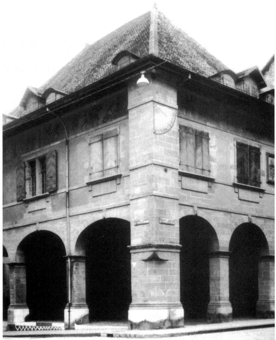
La Halle, arsenal cantonal 1720-1877.

Genève, aujourd'hui, est confrontée à de redoutables et lan-