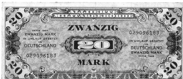
Allemagne 1944 : billet de 20 marks. Ces coupures sont utilisées par les troupes alliées d'occupation en Allemagne.