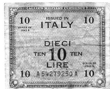
Italie 1943 : une coupure de 10 liras de 1943. On peut lire la valeur en italien et en anglais.

Dans la Légion étrangère, la remise de la solde, comme beaucoup d'autres événements propres à cette formation, revêt