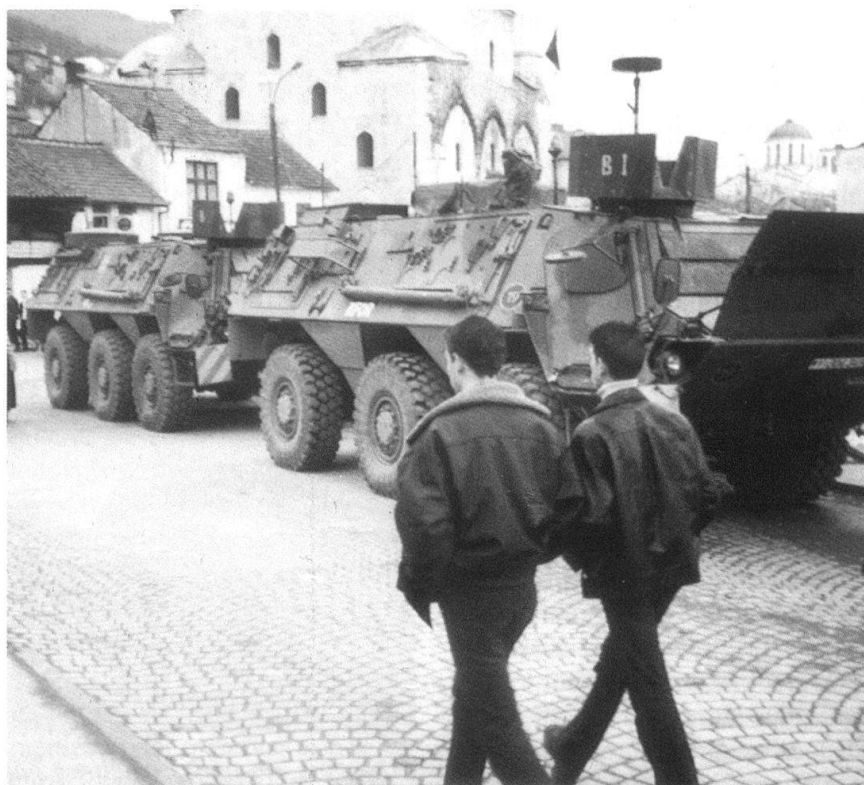
Des blindés allemands à un «check-point» à Prizren.

Six ans après la fin de la guerre, l'ancienne guérilla continue de disposer d'efficaces réseaux d'informateurs qui constituent une véritable police politique. Le Corps de protection du Kosovo (TMK), une force «civilo-militaire» officiellement créée pour offrir une solution de reconversion professionnelle aux anciens guérilleros, en qui cer-