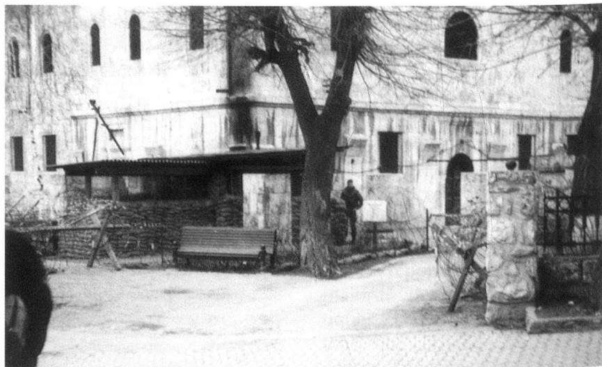
Prizren, une église orthodoxe gardée par des soldats allemands (2001).

L'opinion publique albanaise ne veut pas envisager d'autre option que l'indépendance, une perspective inacceptable pour les Serbes. Les six années de protectorat international auraient pu être mises à profit pour faire