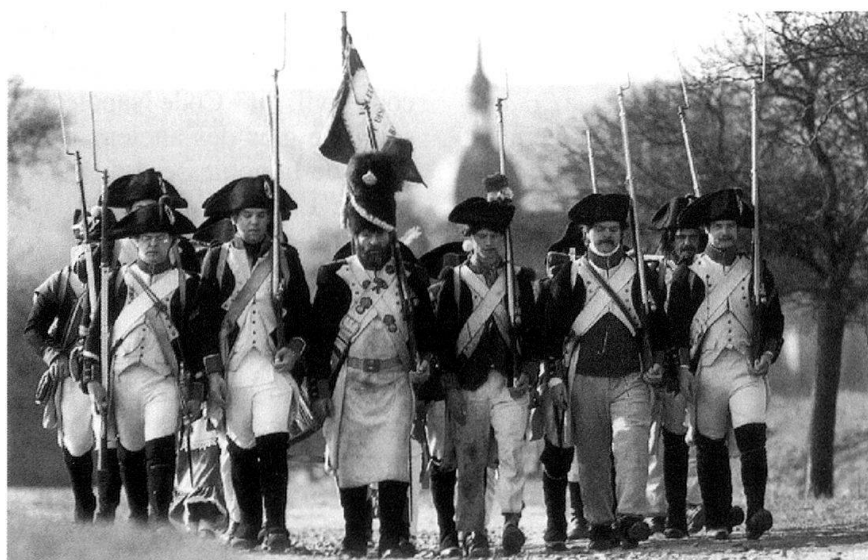
Quelques soldats de l'association privée «Jena 1806 e.V.» en sortie et tenues militaires sur les collines autour d'Iéna. Ils portent les uniformes du 18 e régiment de ligne de l'armée de Napoléon.