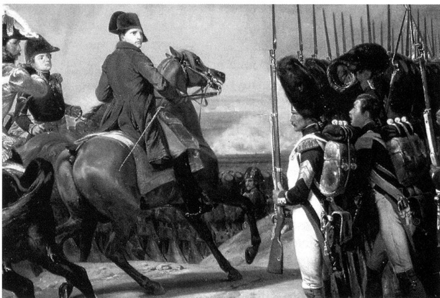
Napoléon I er, le grand vainqueur d'Iéna et d'Auerstedt, passe à cheval en revue ses troupes. Le philosophe allemand G.W.F. Hegel l'intégra dans son système philosophique et nomma ce phénomène «Der Weltgeist zu Pferd» (l'esprit du monde à cheval).