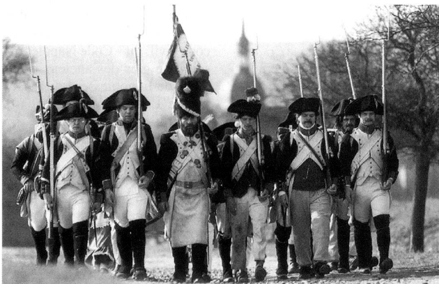
Quelques soldats de l'association privée «Jena 1806 e.V.» en sortie et tenues militaires sur les collines autour d'Iéna. Ils portent les uniformes du 18 e régiment de ligne de l'armée de Napoléon.