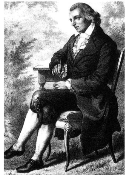
Le poète persécuté Friedrich Schiller (1759-1805), auteur du Wilhelm Tell, reçut un poste de professeur d'histoire à Iéna en 1789.

Des colloques publics, enfin, à l'université d'Iéna, rappelleront, dès le printemps, les grands changements politiques et sociaux intervenus en Prusse, à la suite de ce succès militaire foudroyant de Napoléon I er et de l'occupation militaire qui s'en suivit.