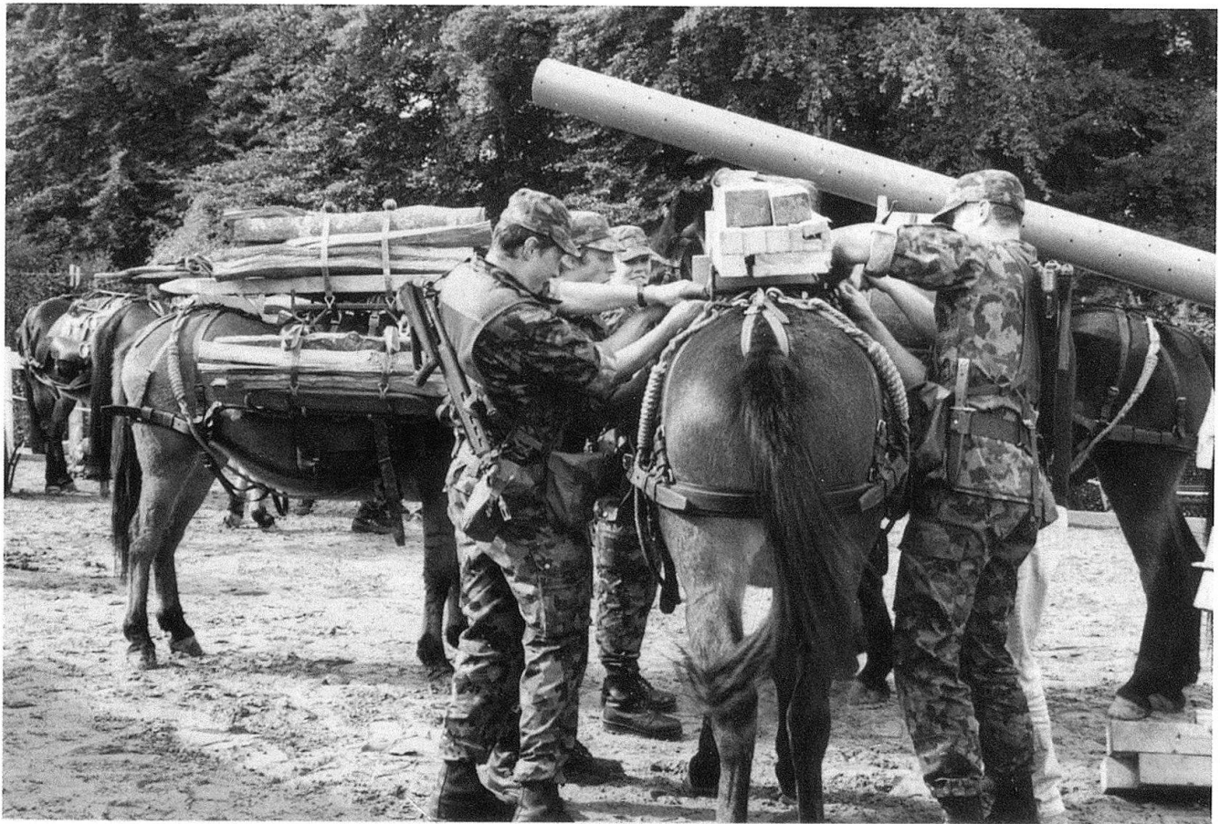
Formation du train à la Foire de Fribourg.

teurs de chiens de défense et de chiens de flair, par exemple pour la recherche de la drogue. Chaque démonstration était accompagnée d'explications, en allemand et en français, données par les militaires.