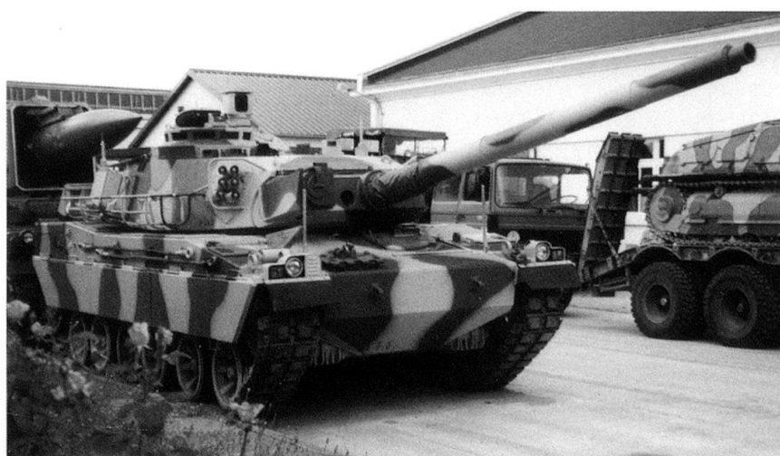
Le char de combat AMX-30.

pacité conventionnelle afin de mener à bien des interventions extérieures de plus en plus fréquentes. On va même assister à un certain découplage, au sein de la doctrine de Défense, entre l'armement nucléaire et l'armement classique, avec une autonomisation croissante de ce dernier. L'Armée de Terre va s'adapter à ce rééquilibrage entre dissuasion et action, c'est-à-dire passer d'une posture défensive de dissuasion globalement sta-