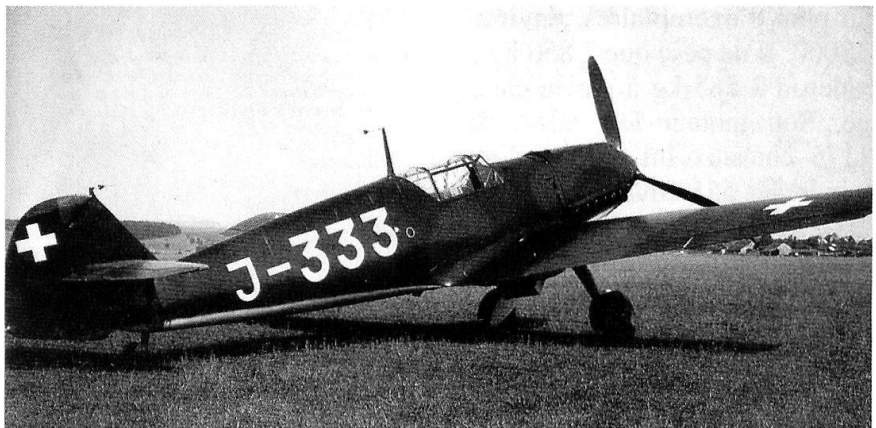
Le puissant Messerschmitt Bf-109 a posé autant de problèmes qu'il en a résolu.

Malheureusement, la production du D-38 ne va pas sans peine. Le démarrage de la produc-