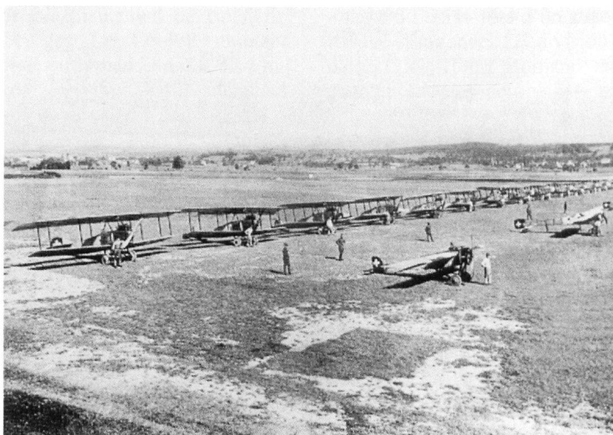
Parade du groupe d'aviation en 1916 sur le terrain de Dübendorf. A l'avant Morane, Blériot, à l'arrière, Wild. L.V.G., DH-1 et Farman.

La Suisse doit mettre sur pied une aviation militaire, la plupart des Etats européens possèdent au moins quelques «unités aériennes», voire de «véritables flottes aériennes». Il faut aménager dans le pays une cinquantaine de terrains et disposer de «pilotes professionnels». Il faut des monoplans avec un pilote et un observateur comme équipage, équipés de téléphonie sans fil, rapides, facilement démontables et réglables, dont le moteur et les commandes soient facilement accessibles, «capables de rouler sur route remorqué par une automobile». Ces appareils, qui décollent et atterrissent sur 100 m avec une charge utile de 300 kg, font du 110 km/h,