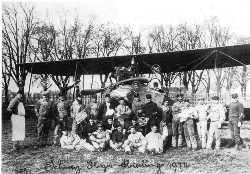
Été 1914 - Les pionniers d'aviation du groupe d'aviation posent devant un L.V.G. sur l'Allemand de Berne. A gauche, on voit le chef de cuisine. L'homme assis et portant un brassard est sans doute l'un des deux mécaniciens étrangers.