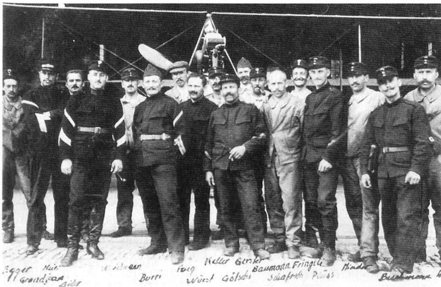
Été 1914 - Les pilotes et les mécaniciens de la première heure.

tomne de 1912, n'a ni avions ni pilotes. Le chef de l'Etat-major général, Theophil von Sprecher, se montre très positif face à l'aviation 5 .