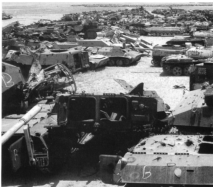
Les mesures de désarmement n'impliquent pas forcément un futur «apaisé»...

Imaginer aujourd'hui que nous puissions demain être délibérément, directement ou personnellement attaqués est inconcevable aux yeux de nombreux dirigeants européens. Cela ne correspond pas à l'image qu'ils se font du monde, de la paix perpétuelle que l'élargissement de l'Union européenne doit rendre inéluctable. En Suisse plus encore que dans le reste du continent, l'idée de guerre est rejetée comme une horreur inconcevable et une absurdité révolue; le fait que la presque