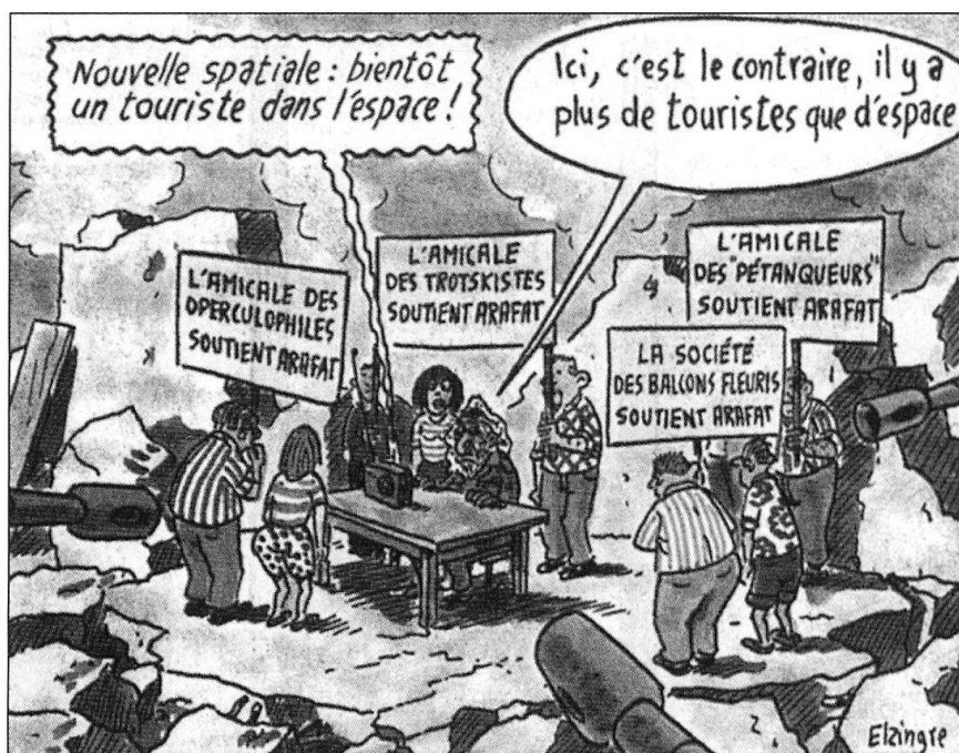
Des haines inextinguibles malgré les manifestations des « gentils ». (L'Express, 25.4.2002).

Si le futur ne recèle qu'un nombre restreint de modes opératoires authentiquement nouveaux, leur addition et leur synchronisation atteindront un degré jusqu'ici inconnu ou ignoré. Les attaques que nous subirons seront une combinai-