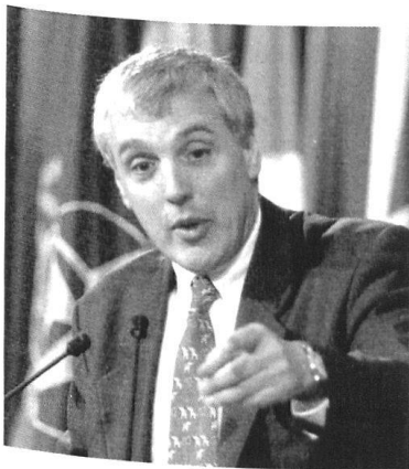
Jamie Shea, porte-parole de l'OTAN, qu'on a beaucoup vu pendant la guerre au Kosovo. Un élément central dans la course à la présence dans les médias est le choix du personnel des relations publiques.

Les relations publiques sont la somme de toutes les activités d'organisations qui visent à influencer le public, respectivement certains groupes signifi-