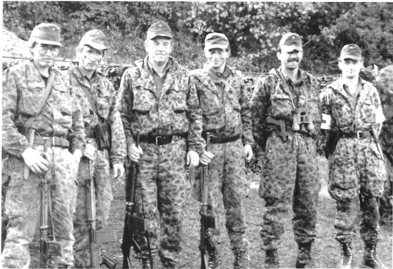
Une raison de scepticisme : si l'armée austro-hongroise et la puissante armée allemande ont été vaincues, comment la petite armée autrichienne pourrait-elle gagner une guerre ?

catif, par la représentation de leurs propres intérêts, pour qu'ils puissent finalement aussi se faire accepter.