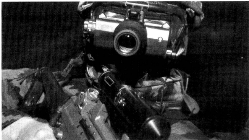
Avec les crédits à disposition, le concept «Armée XXI» est-il réalisable? Ici un appareil de visée nocturne pour le Fusil d'assaut 90.

Die Konsequenzen des Mangels an Berufspersonal für die künftige Armee sind gravierend. Nebst der hohen Belastung der vorhandenen Berufskader in den künftig dreimal beginnenden Schulen, fehlen insbesondere diejenigen Auszubildende, welche die Miliz entlasten sollten. Von den ursprünglich angekündigten Umschulungskursen für die ersten WK-Jahre unter der Leitung der Lehrverbände ist wenig übriggeblieben, das heisst diese müssen unter der Verantwort-