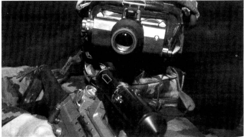
Avec les crédits à disposition, le concept «Armée XXI» est-il réalisable? Ici un appareil de visée nocturne pour le Fusil d'assaut 90.

Die Konsequenzen des Mangels an Berufspersonal für die künftige Armee sind gravierend. Nebst der hohen Belastung der vorhandenen Berufskader in den künftig dreimal beginnenden Schulen, fehlen insbesondere diejenigen Auszubildende, welche die Miliz entlasten sollten. Von den ursprünglich angekündigten Umschulungskursen für die ersten WK-Jahre unter der Leitung der Lehrverbände ist wenig übriggeblieben, das heisst diese müssen unter der Verantwort-