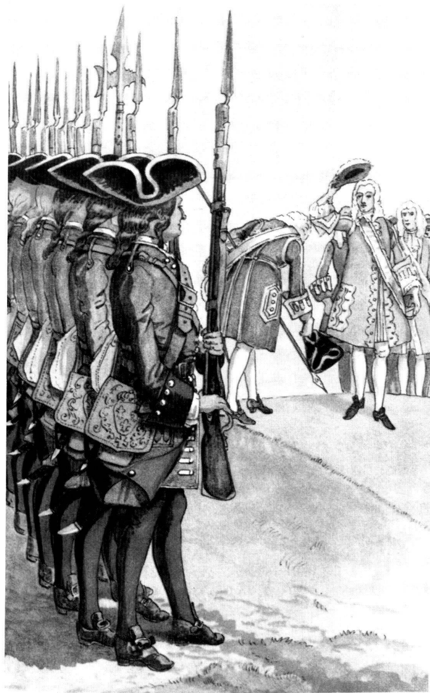
Régiment suisse de Chandieu-Villars au service de France, Ordonnance de 1701. Mousquetaires, au fond des officiers supérieurs.