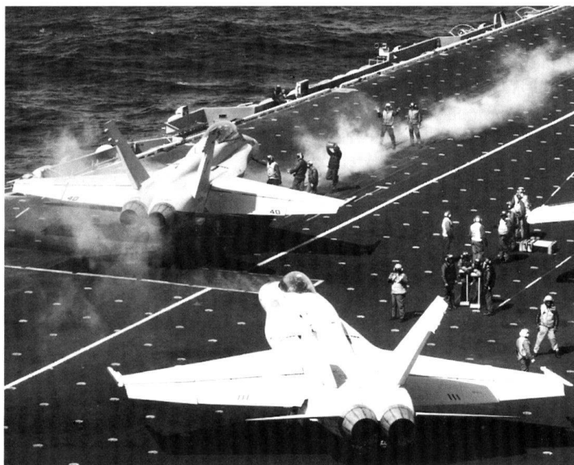
Des F/A-18 en action sur un porte-avions de l'US Navy.

La destruction des missiles Scud par des attaques aériennes s'avère également un semi-