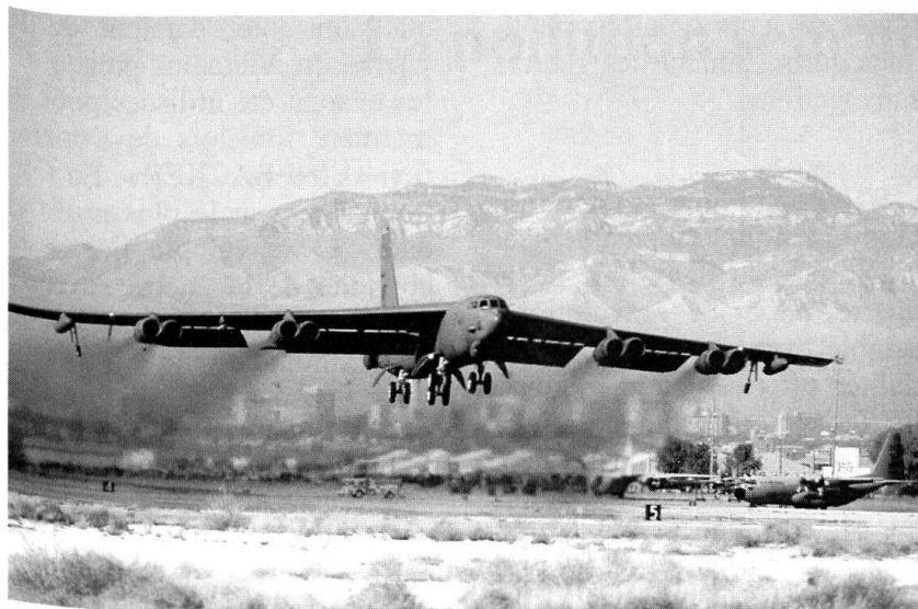
Un bombardier B-52 à l'atterrissage...

quiert, outre une très bonne connaissance de l'objectif, des armes spécifiques à très forte charge explosive ou à très grand pouvoir de pénétration. L'objectif prioritaire, à savoir le système de commandement irakien, est toujours en fonction, après deux semaines et quelque 40000 sorties. Il résiste pendant une durée significative, car il jouit de la protection d'installations enterrées et camouflées.