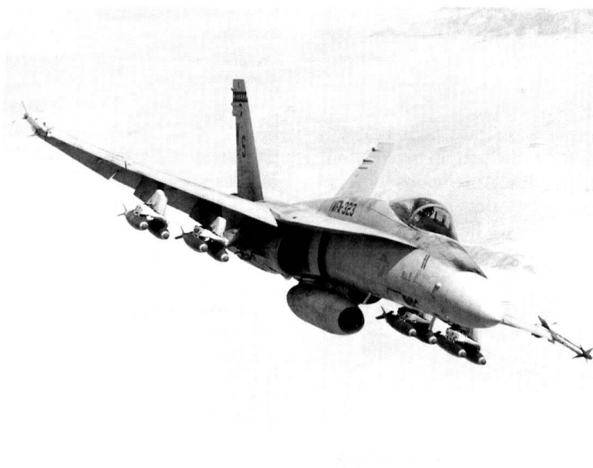
Un F/A-18 survolant le désert de l'Irak.

Quant aux installations de surface, leur destruction re-