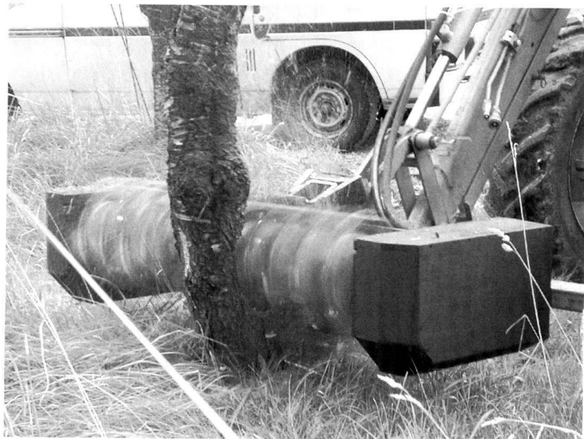
Coupe d'un cerisier avec l'outil de défrichage.

Les démineurs, quand ils coupent la végétation au sécateur, risquent à tout moment de sectionner un fil-piège relié à une mine à fragmentation. Certains ont donc imaginé des véhicules qui feraient ce travail à leur place, bien plus vite et sans que