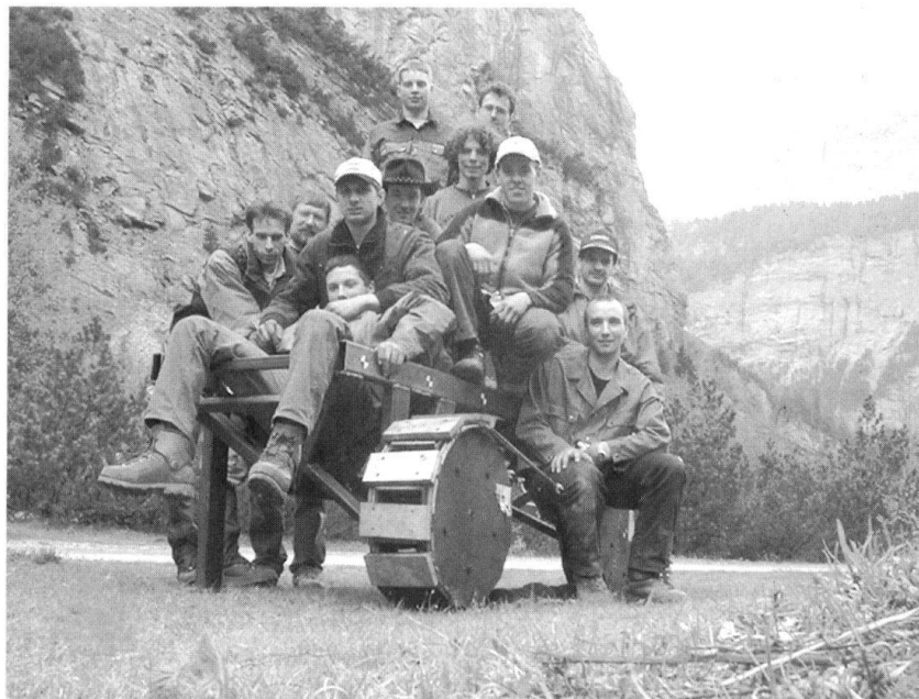
L'équipe jurassienne lors des essais à Kandersteg.

Pendant deux ans, les bénévoles de Digger DTR ont par-