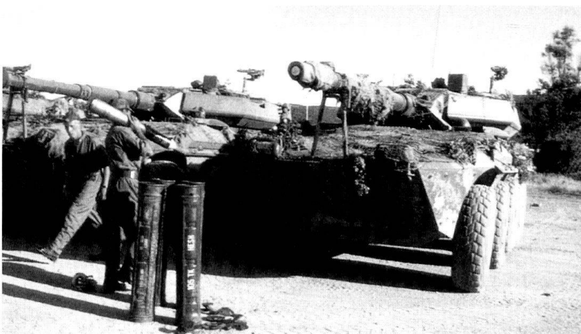
Des cavaliers du 2 e régiment Piemonte Cavalleria complètent la dotation en munitions de 105 mm de leurs Centauro, un engin blindé puissamment armé et doté d'une excellente mobilité.

■ sous condition de réussite au concours d'entrée, l'arme des Carabiniers réserve 1200 postes par an aux anciens engagés; la Garde des finances pourrait offrir dans les mêmes conditions jusqu'à 500 postes par an;