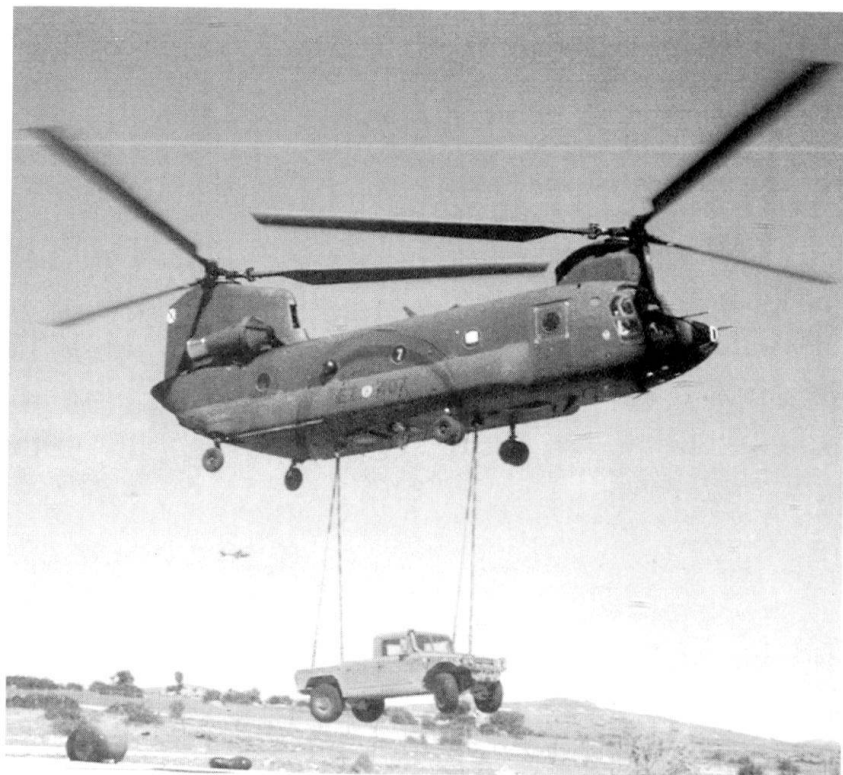
Transport hélicoptère près de Saint-Jacques de Compostelle.

Si un citoyen sait quels sont les intérêts de la nation à laquelle il appartient, quel rôle elle veut jouer dans le monde, comment la défense contribue à la réalisation de ces intérêts nationaux, comment, personnellement, il peut y contribuer, quels moyens humains et matériels sont nécessaires à cette fin, il y aura beaucoup plus de chances qu'il comprenne la nécessité d'un système de défense et le rôle des forces armées en tant qu'élément de ce dispositif. En définitive, avoir une culture de la défense, c'est une manière de contribuer à la défense.