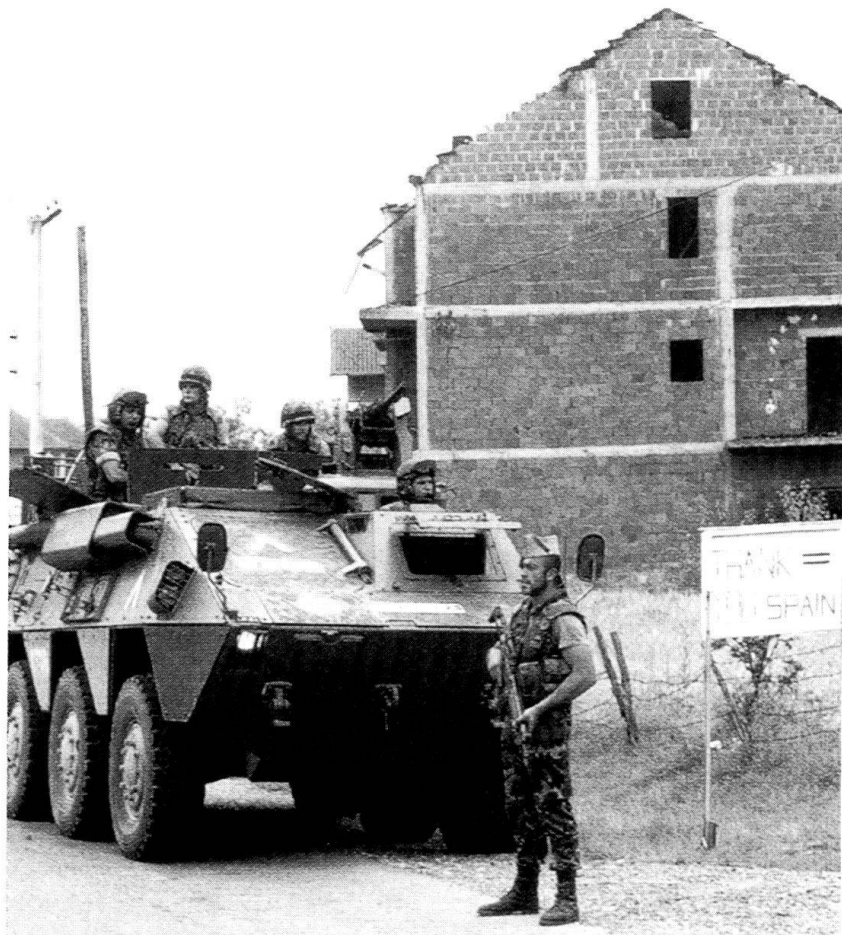
Soldats espagnols déployés au Kosovo.

Souvent, cette assertion est perçue comme une « belle chanson » qui peut être fredonnée en toutes circonstances. Cependant, aujourd'hui comme hier et, certainement demain, c'est une affirmation qui reste vraie. La suppression du service militaire obligatoire et la disparition des menaces traditionnelles dérivées de la guerre froide, qui mettaient en danger la survie même des pays et de leurs populations respectives, ne réduisent pas la nécessité de la participation de tous les citoyens à cette tâche. Et leur contribution à la défense ne se limite pas au service militaire :