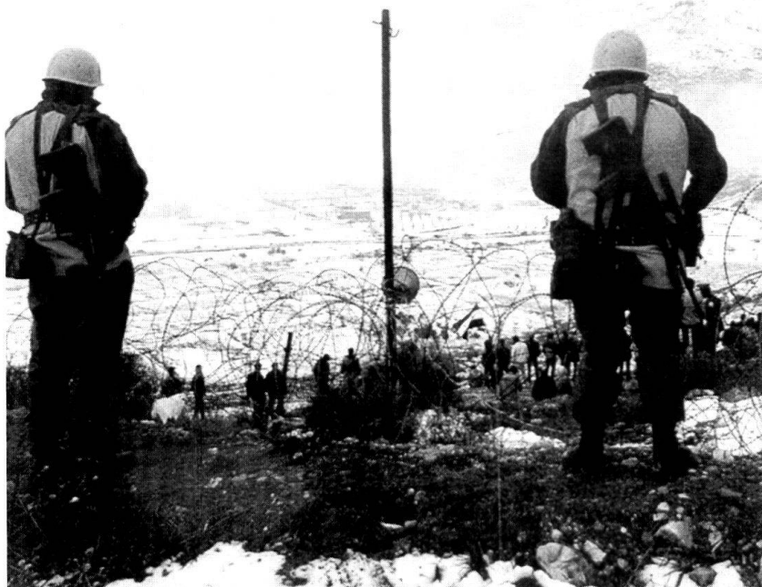
Des Casques bleus en opération de maintien de la paix en Bosnie.

Un second défi majeur pour les pays membres de l'UE sera