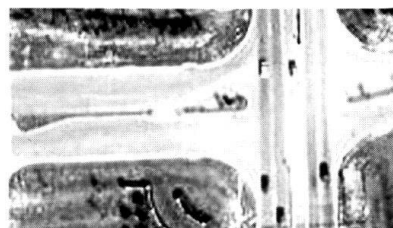
Vue du terrain par des satellites performants.

L'armée américaine a réduit de moitié ses divisions blindées mais a maintenu ses capa-