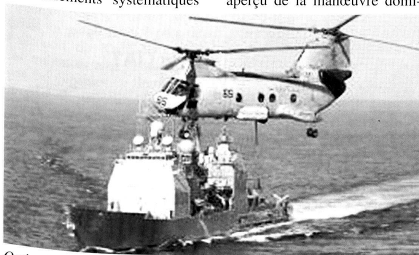
Opération interarmées américaine contre l'Afghanistan...

La forte dépendance vis-à-vis des drones apparaît comme