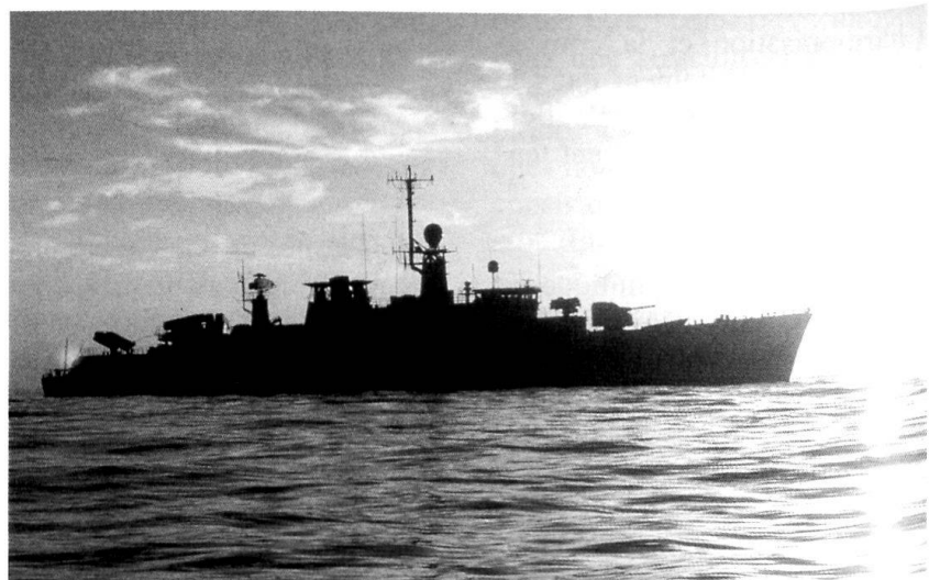
Une unité de la Marine belge.

Pour élargir son assiette de recrutement, l'armée doit s'adapter davantage à l'offre du marché et, par conséquent, s'efforcer d'être plus attractive pour les femmes. En effet, alors que le nombre d'hommes disponibles sur le marché de l'emploi diminue, on assiste à une augmentation du nombre de femmes cherchant du travail. Un exemple de mesure que l'on pourrait prendre serait de