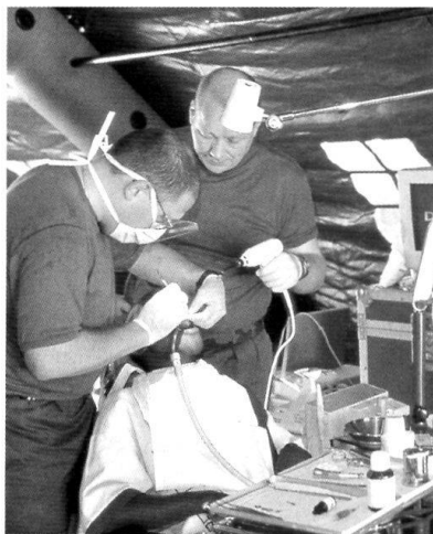
Intervention médicale dans un poste de secours.

De telles circonstances sont pourtant le moment idéal pour corriger les fautes du passé dans la nouvelle structure à mettre en place. Parmi celles-ci, nous pensons notamment à l'intrusion du monde politique dans des questions qui relèvent exclusivement des militaires. En second lieu, il faut avoir le courage de s'engager radicalement dans une voie complètement nouvelle. Une entreprise qui subit une métamorphose doit sortir renforcée de ce processus. Il est très important que de telles réformes soient soutenues par la base.