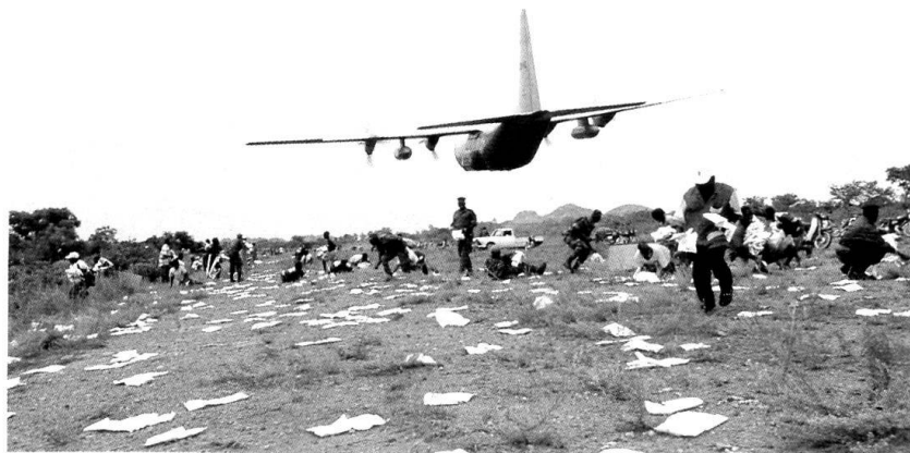
Largage en rase-mottes de nourriture d'urgence.

Comme toute grande organisation, l'armée a besoin en permanence d'un afflux de nouveaux collaborateurs. Le succès du recrutement dépend en grande partie de la dispersion