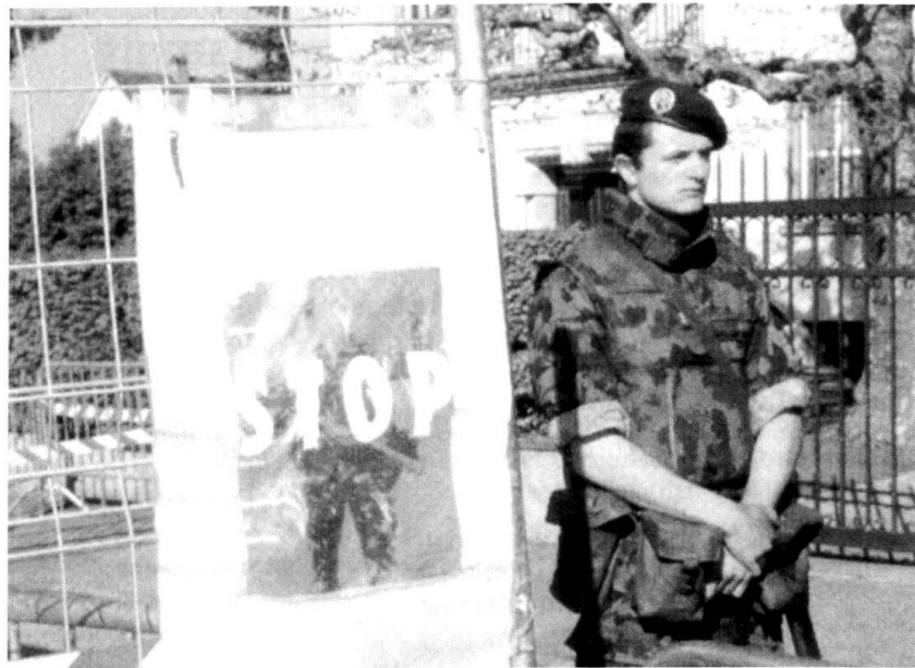
La menace terroriste sous-tend les principes des engagements subsidiaires de l'armée, entre autres pour la protection des ambassades.