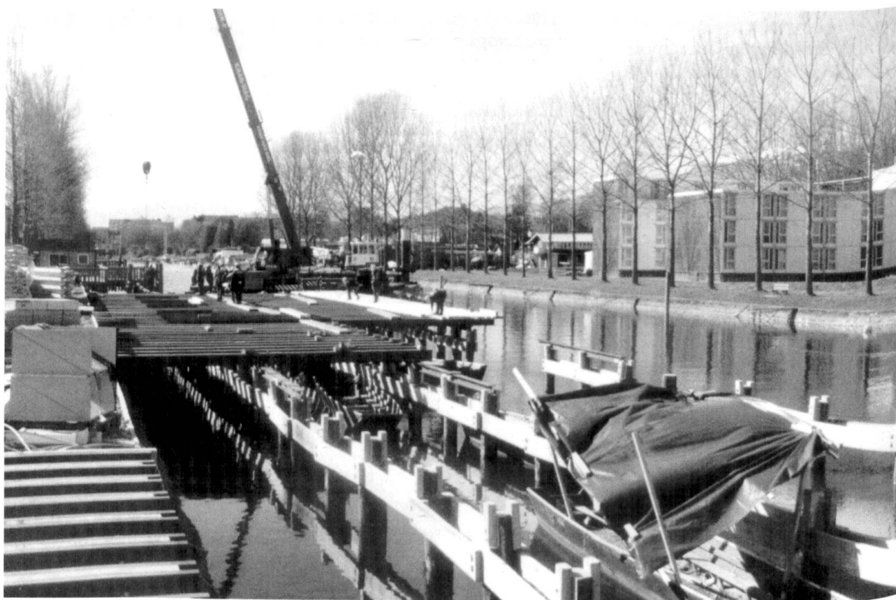
Finition du plancher.