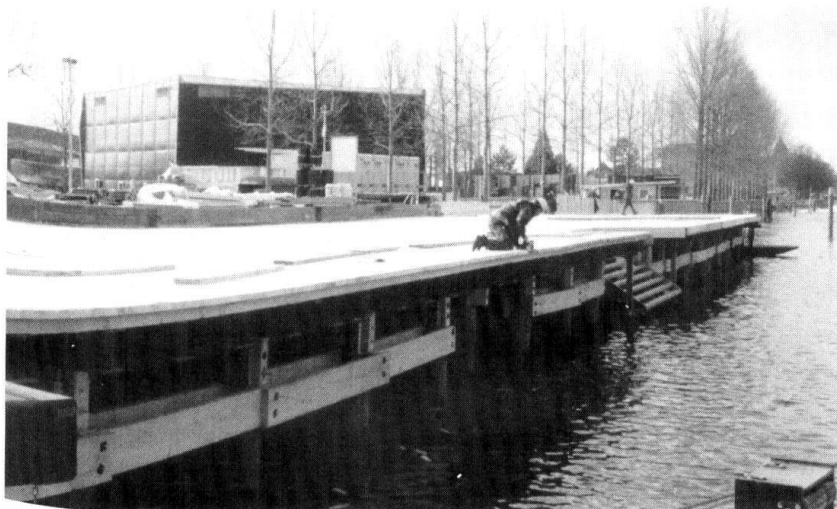
Pose du plancher du débarcadère de la navette Iris .