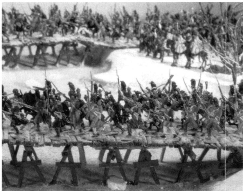
Passage de la Bérézina, 25-28 novembre 1812 (Morges, Musée de la figurine).

il faut désormais «nourrir» les armes et les machines. Encore sous le Premier Empire, une troupe peut combattre par le fer si les munitions manquent ou si la pluie l'y oblige. Ce n'est plus le cas aujourd'hui, puisque la capacité de combat d'une troupe se mesure aux munitions qu'elle dispense. Le 7 mai 1954, les 10000 hommes de la garnison française de Dien Bien Phû se rendent au Viêt Minh après avoir épuisé leurs munitions. Un combat à la baïonnette aurait semblé suicidaire. Dien Bien Phû s'avère une défaite logistique française. Dans les mêmes conditions de siège et d'encerclement, Khe San (1968) est une victoire de la logistique américaine. La sur-extension logistique arrive quand l'intendance ne suit plus. C'est alors qu'intervient «la force décroissante de l'attaque» mise en évidence par Clausewitz.