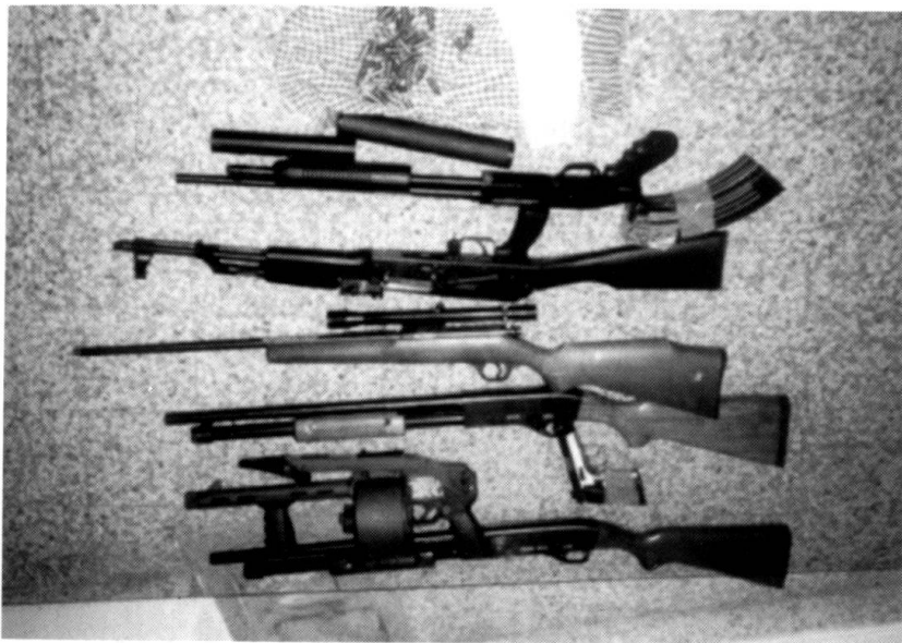
Découverte d'un trafic d'armes en faveur de l'UCK.

lité de capitale, abrite de nombreuses représentations diplomatiques.