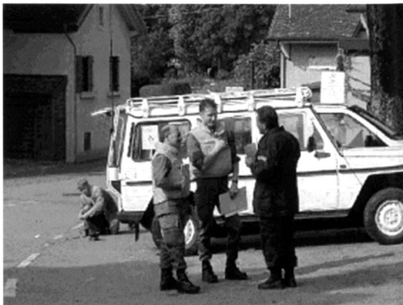
Une importance particulière est donnée à la protection des représentations diplomatiques et des organisations internationales (illustration: occupation du siège de l'OMC à Genève en 1999).

La protection des représentations diplomatiques et des organisations internationales revêt aussi une importance particulière dans ce contexte, surtout si l'on pense aux rôles tenus par Genève, où siègent plusieurs organisations internationales et qui accueille de nombreuses rencontres internationales, et par Berne qui, en qua-