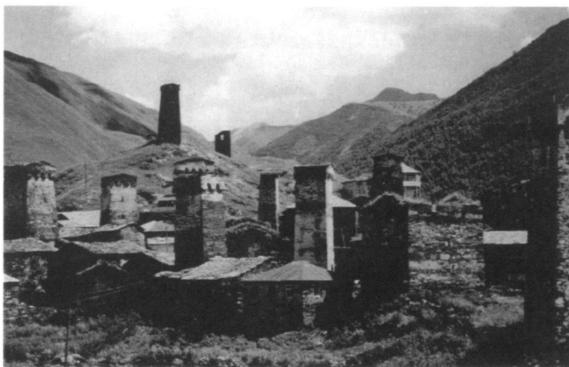
La Svanétie, région montagneuse située au Nord-Ouest de la Géorgie, à proximité de l'Abkhazie et de la Russie.

Autre concurrent sérieux: le Royaume-Uni. L'intérêt de celui-ci pour la Transcaucasie remonte à la fin du XVIII e siècle, au moment où la Couronne britannique s'emparait des Indes, alors même que la Géorgie se tournait vers la Russie. Dès lors, la Transcaucasie fit partie intégrante du «Grand Jeu» auquel se livrèrent Britanniques et Russes pour le contrôle ou la neutralisation de cette région. Dès la fin de la guerre froide, Londres fut l'une des premières capitales à renouer avec Tbilissi et à mettre en place une coopération significative. Rappelons simplement deux faits: British Petroleum est la société occidentale qui investit le plus dans le projet d'oléoduc Bakou - Ceyhan et la société anglo-géorgienne Canargo vient de découvrir un gisement pétrolifère prometteur dans la région de Ninotsminda. Pour le Royaume-Uni, la Géorgie constitue à la fois un point d'encrage dans le Caucase et un enjeu économique potentiellement important. Londres n'en conserve pas moins un profil beau-