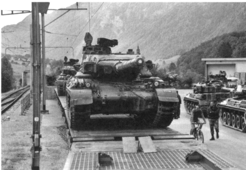
Chargement des AMX 30 à Schwanden.

En revanche, sur le plan administratif, la collaboration était nulle ou presque, et cela tant de la faute des Français que des Suisses. L'exemple des munitions. Dès le départ, les militaires suisses et français ont convenu de faire en sorte que leurs services techniques respectifs (STAT en France, et GDA en Suisse) échangent directement les informations nécessaires aux procédures d'au-