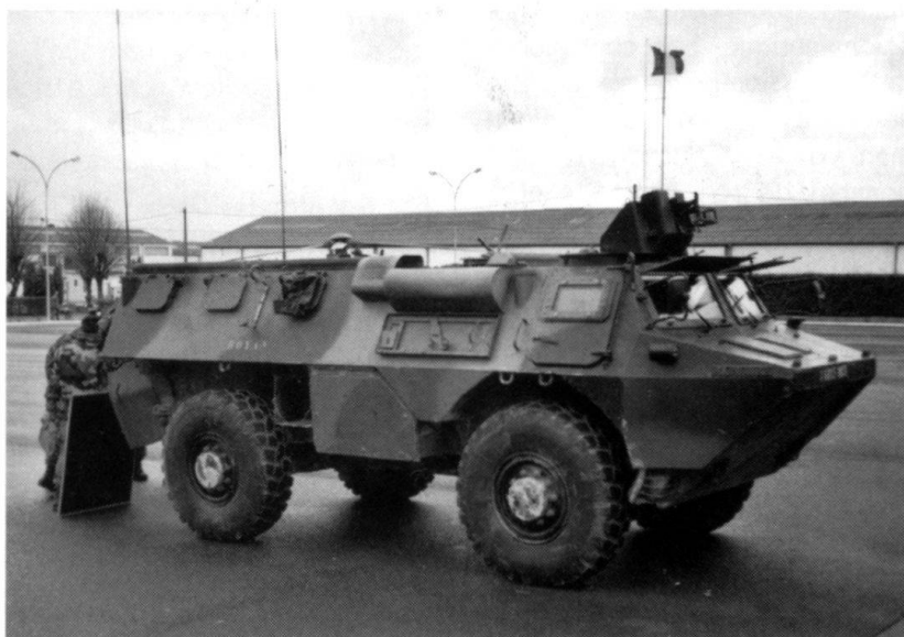
Véhicule blindé de l'avant du 40 e régiment d'artillerie de Suippes.

500 chars Leclerc ont été livrés aux armées de la France et des Emirats arabes unis sur les 761 au total qu'elles ont commandés et la production en série se poursuit. Par ailleurs, la France prévoit d'acquérir 96 Leclerc