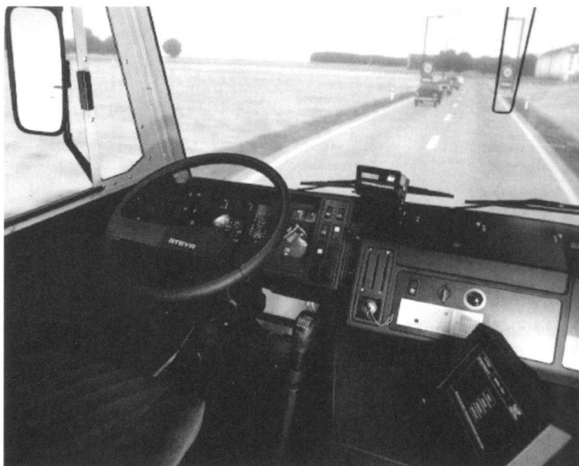
Vue intérieure de la cabine. La vue du chauffeur est une image virtuelle construite par un système d'ordinateur.

Pour évaluer la leçon d'auto-école, on surveille en permanence l'usage correct du véhi-