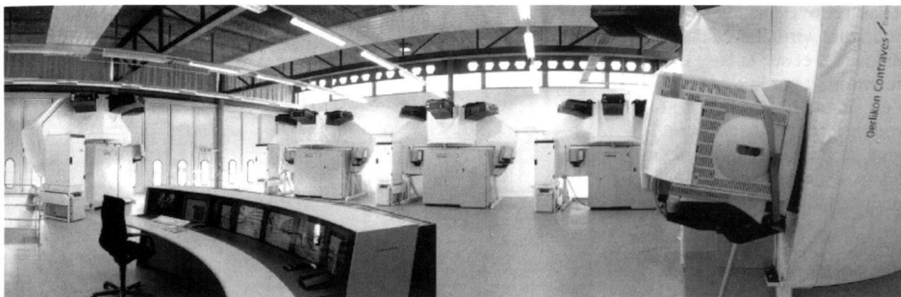
Système d'entraînement avec 5 simulateurs de conduite et la station d'instruction.

restriction. Sept autres systèmes ont été commandés dans le cadre du crédit de 38,5 millions approuvé par le Parlement avec le programme d'armement 1997. Ces systèmes seront livrés en 2000 et 2001. Le projet d'acquisition initial a été réduit d'une unité dans l'optique de la réforme «Armée XXI». Le crédit ne sera donc pas totalement dépensé. Les troupes de transport vont recevoir sur huit places d'armes un moyen moderne, destiné à une formation des conducteurs de camions aussi réaliste que possible.