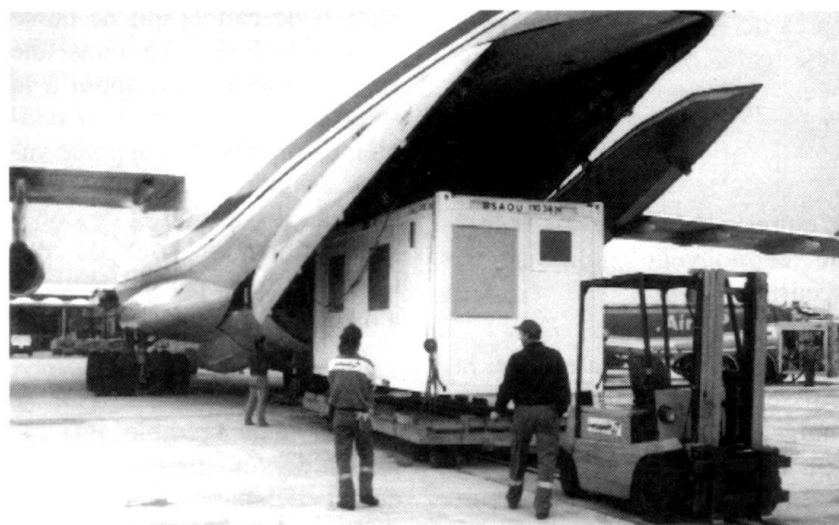
La coopération... La Suisse ne peut rester isolée et repliée sur elle-même. Elle doit participer aux efforts de maintien de la paix dans des régions «chaudes». Ici embarquement à bord d'un Ilyushin-76 de conteneurs de la SWISSCOY.