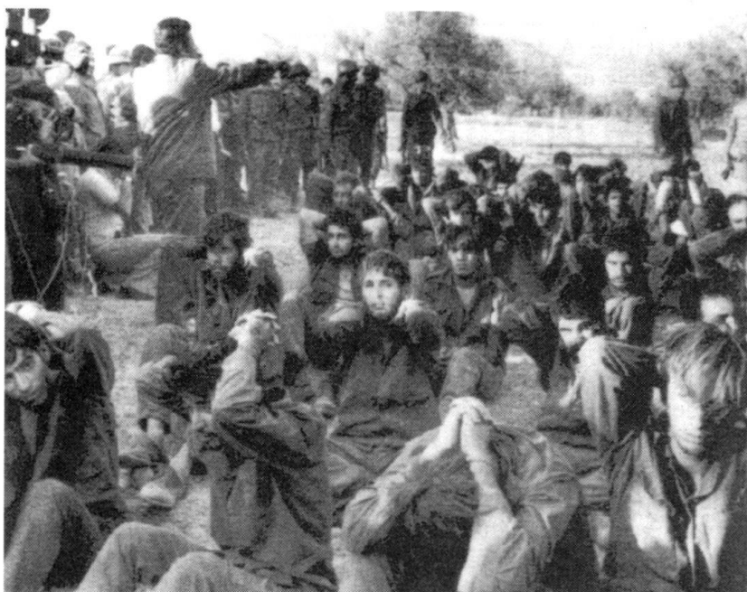
Dans tous les conflits, les prisonniers de guerre posent des problèmes d'organisation. Ici, des prisonniers israéliens aux mains de Syriens en 1973.

A l'heure où les militaires occidentaux capturés en opération ne sont plus considérés comme des prisonniers de guerre, mais comme des otages 4 , où les factions en guerre ne semblent plus faire beaucoup de prisonniers (Rwanda, Kosovo, Tchétchénie et ailleurs), où les médias n'attirent plus l'attention de l'opinion publique sur