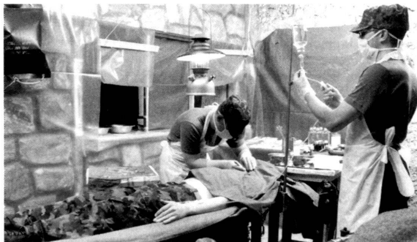
...Pourtant, les militaires doivent savoir travailler dans des conditions rustiques!