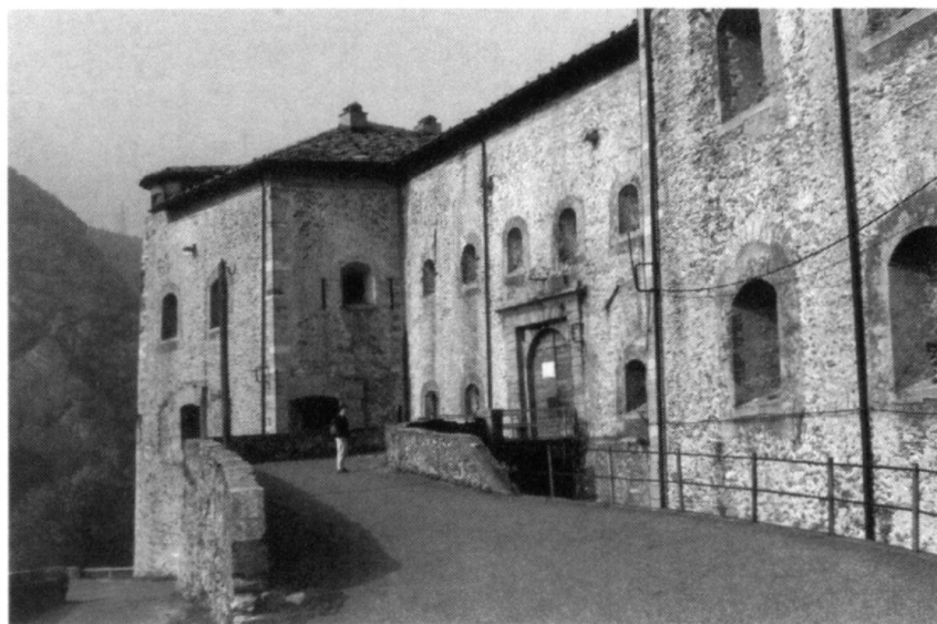
L'entrée du fort «Carlo Alberto». Cette face du fort regarde vers l'aval de la Vallée d'Aoste, en direction d'Ivrea.

26 mai. — L'attaque est menée à partir de 3 heures du matin. 3 colonnes, fortes chacune de 300 hommes équipés d'échelles, quittent leurs secteurs d'attente. Les Français s'avancent tout d'abord en silence vers les enceintes, mais une sentinelle autrichienne, vigilante, donne l'alarme; Bernkopf