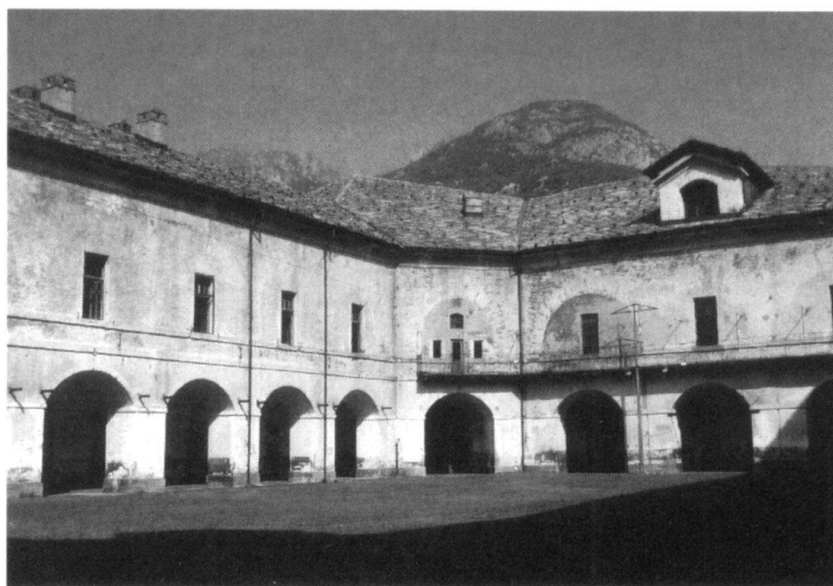
Le fort «Carlo Alberto». La cour principale.

2 juin. — Au matin, la garnison autrichienne, forte de 400 hommes, évacue le fort et se constitue prisonnière. 18 canons, ainsi que des approvisionnements sont récupérés par les troupes françaises. Suite à la chute de cet important point de passage obligé de la vallée d'Aoste, le ravitaillement de