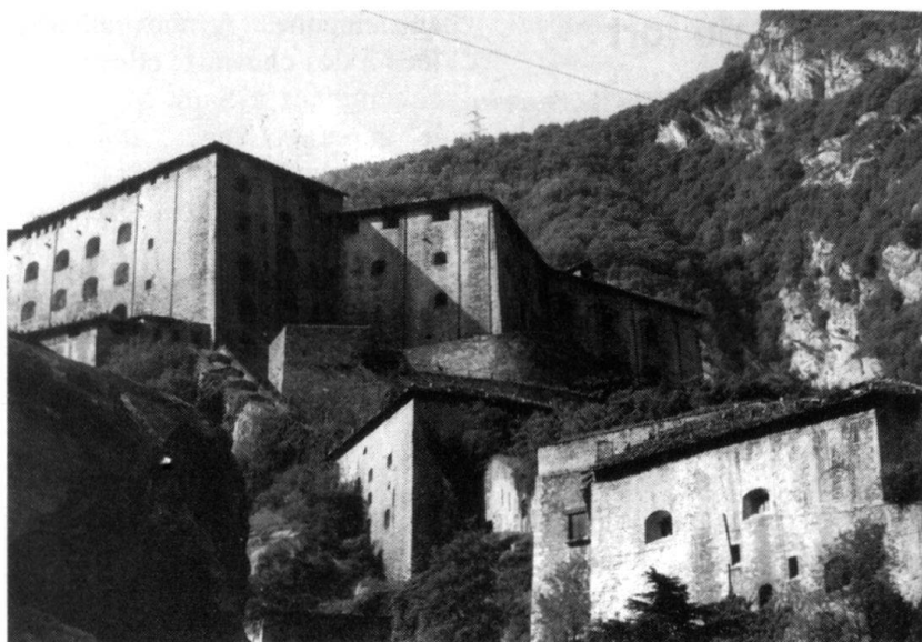
Les trois éléments du nouveau fort de Bard: au premier plan, le fort «Fernandino», puis le fort «Vittorio» et, coiffant le sommet du rocher, l'élément principal, le fort «Carlo Alberto».

«(...)1500 hommes commandés pour aller pratiquer un chemin sur la montagne d'Albard y travaillent avec activité. Là, où la pente eût été trop rapide, des escaliers sont construits;