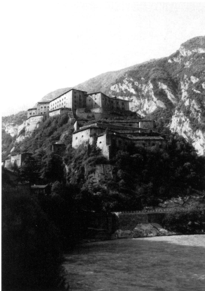
Le fort de Bard tel qu'on le découvre en descendant la vallée d'Aoste. Sa masse barre le passage et oblige la rivière, la Doire Baltée, à le contourner. A la base du rocher, la nouvelle route réalisée en 1857 (route nationale N° 26).

23 mai. — Berthier donne les ordres suivants aux troupes qui assiègent le fort de Bard: dès 7 heures, l'artillerie fera feu de toutes ses pièces, à la cadence de 4 coups à l'heure pour les pièces de 8 et les obusiers, et