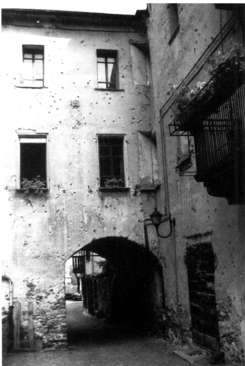
Village de Bard. Les façades de cette maison, la «Casa Nicole», portent encore les traces de balles et de mitraille des combats de 1800. A l'époque, la seule et unique route de la vallée, entre Aoste et Ivrea, passait sous cette voûte et traversait le pittoresque village de Bard!

gés, placés de manière à pouvoir s'appuyer les uns les autres, nommés «Fernandino» pour le fort inférieur (400 m), «Vittorio» pour le fort intermédiaire (425 m) et «Carlo Alberto» pour le fort couronnant le sommet du rocher de Bard (467 m). Parmi les officiers du