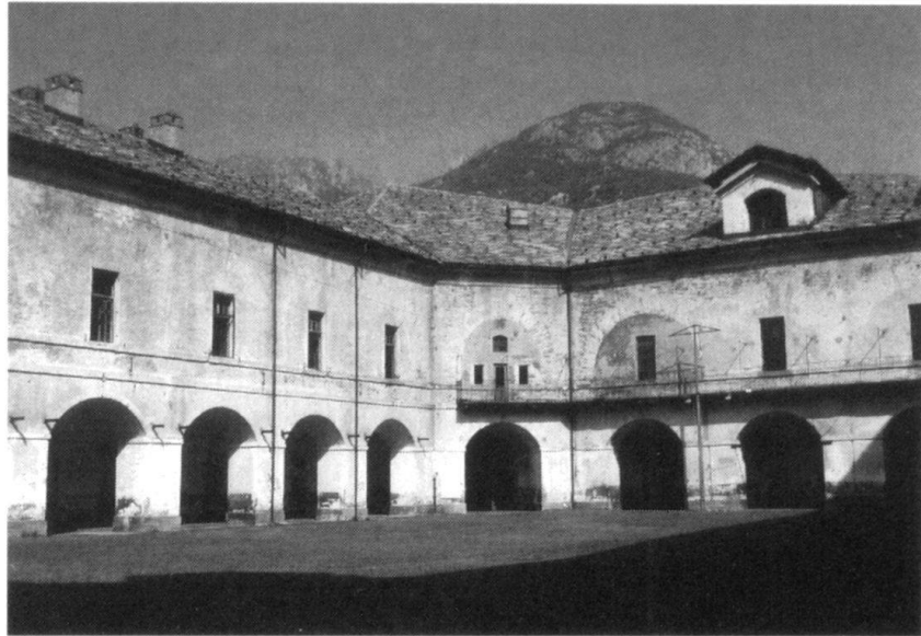
Le fort «Carlo Alberto». La cour principale.

2 juin. — Au matin, la garnison autrichienne, forte de 400 hommes, évacue le fort et se constitue prisonnière. 18 canons, ainsi que des approvisionnements sont récupérés par les troupes françaises. Suite à la chute de cet important point de passage obligé de la vallée d'Aoste, le ravitaillement de