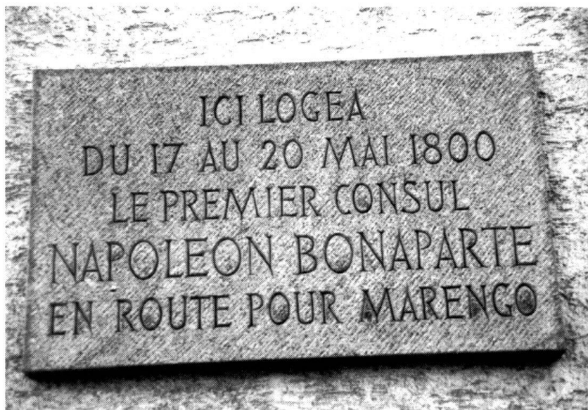
Martigny. La plaque apposée sur la Maison des Chanoines du Grand Saint-Bernard.

Le mouvement sur le Simplon ou sur le Saint-Gothard deviendra très sensible à l'ennemi vers le 5 ou le 6 prairial. Nous avons 10 pièces sur affûts-traîneaux qui pourront appuyer les positions de l'armée. Pendant tout ce temps-là, l'artillerie achèvera de passer, les corps en arrière arriveront, et cependant la diversion sur Gênes n'en sera pas moins en partie faite.