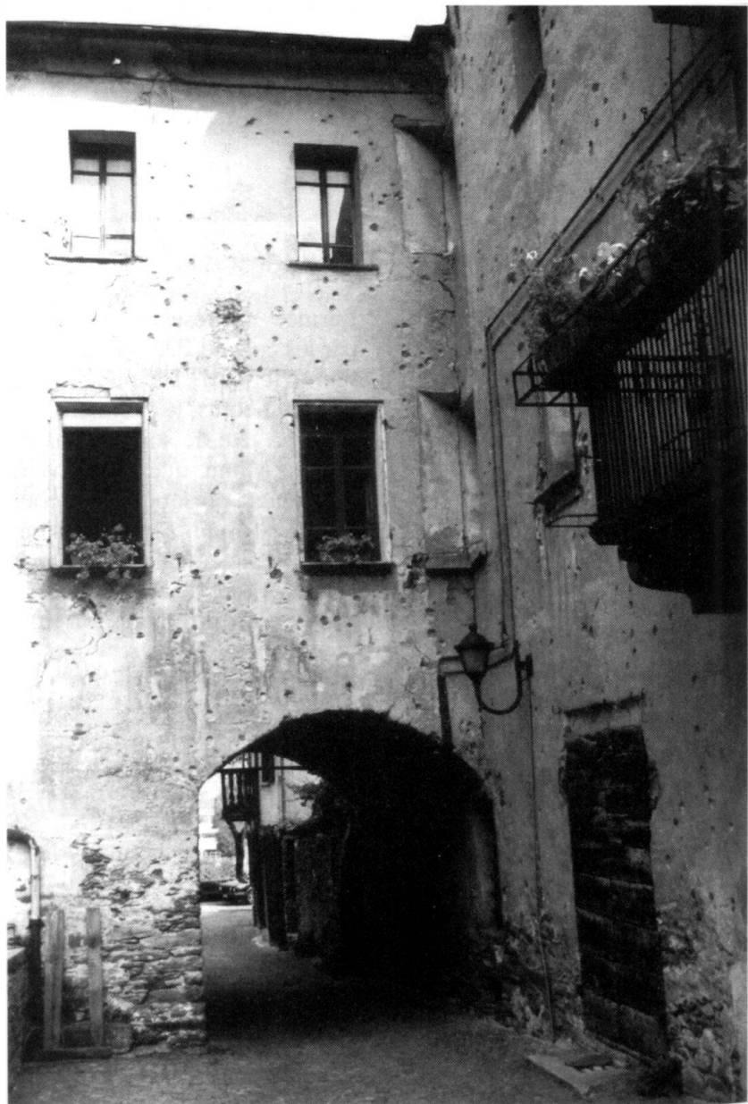
Village de Bard. Les façades de cette maison, la «Casa Nicole», portent encore les traces de balles et de mitraille des combats de 1800. A l'époque, la seule et unique route de la vallée, entre Aoste et Ivrea, passait sous cette voûte et traversait le pittoresque village de Bard!

gés, placés de manière à pouvoir s'appuyer les uns les autres, nommés «Fernandino» pour le fort inférieur (400 m), «Vittorio» pour le fort intermédiaire (425 m) et «Carlo Alberto» pour le fort couronnant le sommet du rocher de Bard (467 m). Parmi les officiers du