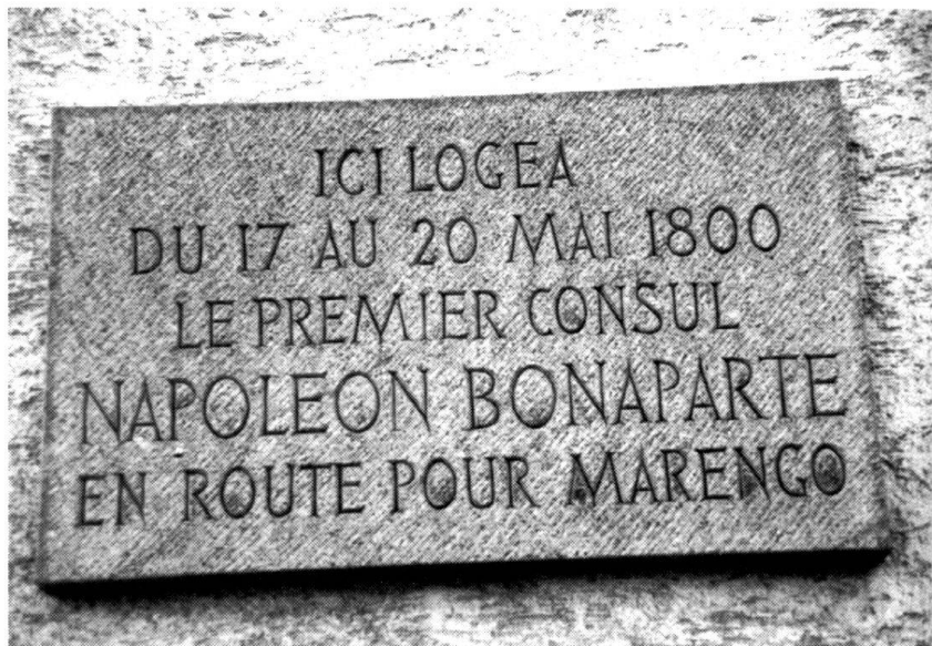
Martigny. La plaque apposée sur la Maison des Chanoines du Grand Saint-Bernard.

Le mouvement sur le Simplon ou sur le Saint-Gothard deviendra très sensible à l'ennemi vers le 5 ou le 6 prairial. Nous avons 10 pièces sur affûts-traîneaux qui pourront appuyer les positions de l'armée. Pendant tout ce temps-là, l'artillerie achèvera de passer, les corps en arrière arriveront, et cependant la diversion sur Gênes n'en sera pas moins en partie faite.