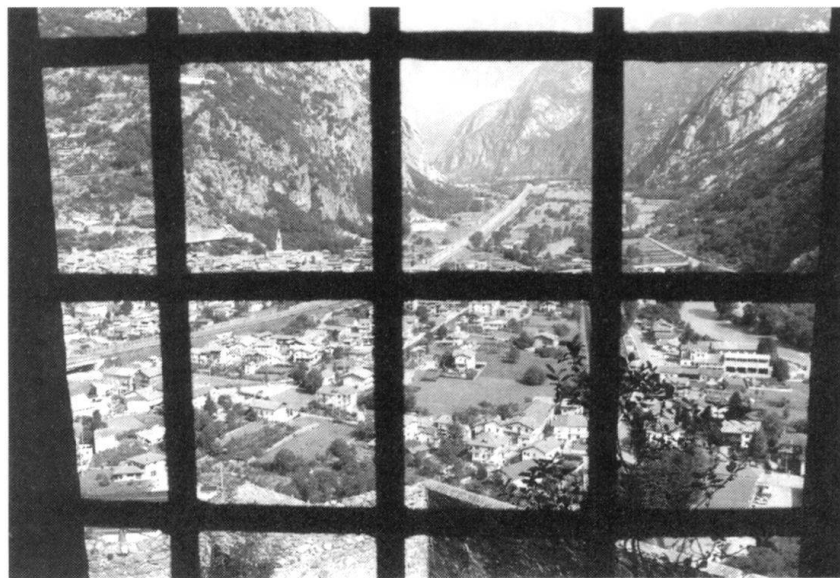
La vallée, en direction d'Aoste. Cette vue, prise du fort, permet de constater sa position dominante. A droite, on distingue la rivière, la Doire Baltée et, à gauche, le village de Hohné ainsi que l'autoroute Aoste-Turin.

Il sert ensuite de station militaire d'observations météorologiques puis, vers 1900, devient magasin de munitions. A partir de 1935, il abrite notamment les stocks de grenades destinées à la campagne d'Afrique! Après la Seconde Guerre mondiale, il est utilisé comme «simple dépôt de cartouches», gardé par les nouveaux «Alpini», omniprésents dans cette vallée d'Aoste, jusqu'à la publication, en 1975, d'un décret dans la Gazzetta Ufficiale qui annonce sèchement le transfert du domaine militaire au patrimoine de l'Etat de «l'immeu-