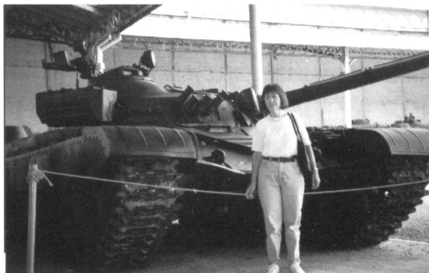
Musée royal de l'armée: un T-72 soviétique. La personne au premier plan (1,65 m) pour rendre sensible à la faible hauteur du char, ce qui pose de gros problèmes d'habitabilité dans la tourelle.

poque du nazisme. Les communications suisses, qui traitent de la défense générale du pays pendant et après la Seconde Guerre mondiale, suscitent intérêt et compréhension.