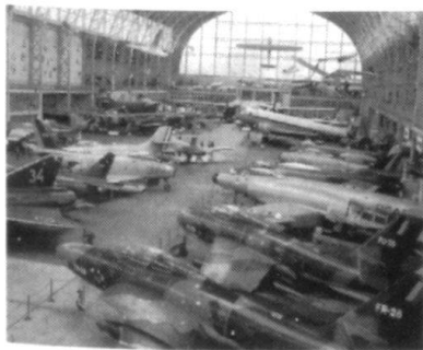
Musée royal de l'armée: vue de la halle consacrée à l'aviation.

Aux colloques de la Commission internationale d'histoire militaire, contrairement à ce que prétendent certains médias, la Suisse ne passe pas pour la «brebis galeuse», dont les autorités et la population ont commis toutes les turpitudes à l'é-