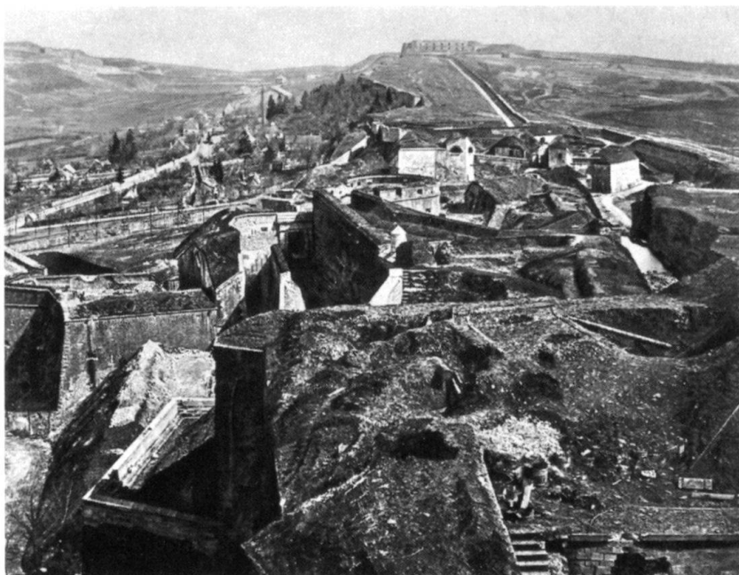
Le fort de la Justice et la tour des Bourgeois vue depuis la terrasse du Château.