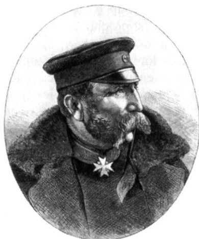
Von Treskov, général-commandant le Royal Prussien des troupes concentrées devant Belfort.

dent de parcours qui permet de mieux comprendre le déroulement ultérieur parfois insolite de sa carrière. Un rapport du directeur du génie de la place, deux notes émanant du cabinet du ministre exposent les faits.