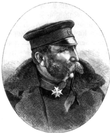
Von Treskov, général-commandant le Royal Prussien des troupes concentrées devant Belfort.

dent de parcours qui permet de mieux comprendre le déroulement ultérieur parfois insolite de sa carrière. Un rapport du directeur du génie de la place, deux notes émanant du cabinet du ministre exposent les faits.