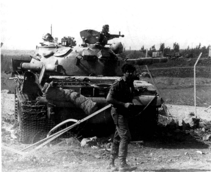
Un officier israélien inspecte l'épave d'un T-62 syrien, touché à proximité de l'un des principaux dépôts de munitions de la 7 e Brigade

Avec une compagnie de chars, il essaie de protéger l'accès d'Al-Jukhadar et El-Al par la «Tapline Road», route parallèle à la ligne de front. Les combats sont féroces. Les tireurs d'élite syriens prennent pour cible les commandants de chars israéliens debout dans leurs tourelles; les équipages des deux camps combattent, non seulement au canon, mais encore à l'arme personnelle et à la grenade. Le commandant de la 9 e division d'infanterie syrienne, le colonel Hassan Tourkmani, se rend compte de la faiblesse des Israéliens et profite de son avantage pour engager des unités supplémentaires dans la bataille. A 21 h, les Syriens ont plus de 200 chars engagés dans le combat contre la 188 e brigade. Ils avancent au nord vers Nafakh, au sud en direction des ponts sur le Jourdain.