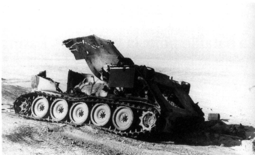
Touché par un coup direct, ce qu'il reste d'un M-113.

Le 13 septembre 1973, une patrouille israélienne, composée de F-4E , RF-4E et de Mirage III C , en reconnaissance près du port de Latakia, est at-