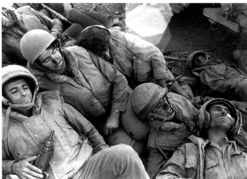
Épuisés, ces artilleurs tentent de récupérer après 48 heures de combat sans répit.

A 13 h 50, alors que les soldats des 188 e et 7 e brigades sont sur le pied de guerre, les premiers bruits de rotors d'hélicoptères se font entendre au nord, en direction du mont Hermon. Dix minutes plus tard, ce ne sont plus qu'explosions sur le Golan: l'offensive syrienne est massive. Les chasseurs Sukhoi-7 , volant à basse altitude, hachent le terrain avec leurs canons de 30 mm et leurs roquettes de 37 mm, avant de lâcher des bombes de 500 et 750 kg. Après la préparation aérienne, l'artillerie entre dans la danse avec des tirs de barrage concentrés. Plus de 200 batteries d'artillerie, en position sur territoire syrien, répandent la mort et la destruction. D'après un fantassin israélien, «ce fut le plus fantastique déploiement de puissance que j'aurais pu imaginer.»