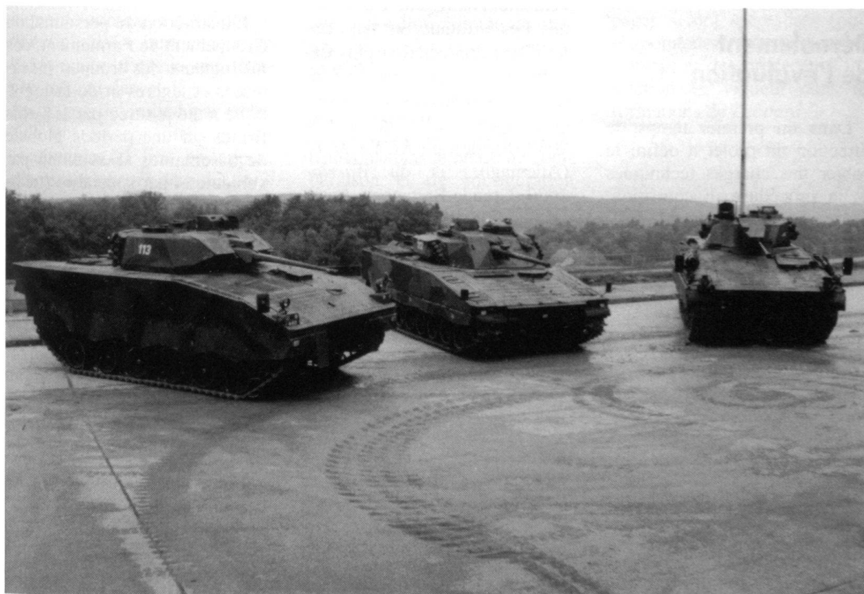
De gauche à droite : Warrior 2000, CV 9030, KUKA M 12.

Le Char de grenadiers 2000 doit pouvoir transporter au minimum 7 grenadiers complètement équipés ; son plan de char-