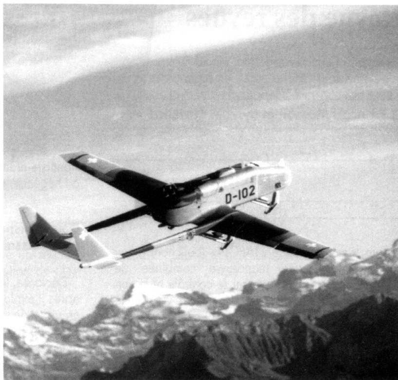
Le système Drone ADS 95.

Dans sa séance spéciale du 27 janvier, le Conseil fédéral a pris connaissance de l'état d'élaboration du rapport sur la politique de sécurité 2000. Il a édicté des directives, notamment en vue de la poursuite de l'étude sur l'obligation générale de servir, qui n'exclut pas recrutement de personnes de la même catégorie d'âge pour l'armée et pour la protection de la population, l'obligation de faire du service dans la protection de la popula-