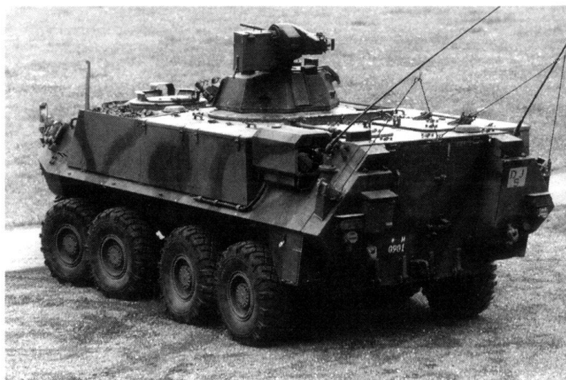
Le Piranha 8 x 8.

L'acquisition des avions de combat F/A-18 continue à bien se dérouler. Le calendrier et les prestations répondent aux attentes. Le coût total de l'opération devrait se situer environ 200 millions en dessous du crédit d'en-