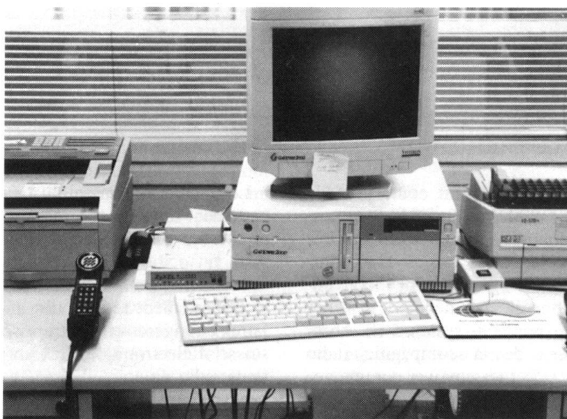
Place de travail du Système radio d'ambassade 98 établie à Helsinki.

Une première estimation montre que l'engagement d'ingénieurs ou de fonctionnaires pour les essais de stations exté-